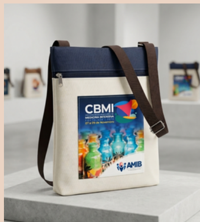
Bolsa Carteiro Simples com Bolso externo Sublimado.

Exemplos: Mochilinha em tactel, bolsas em Nylon, Couro Sintético Feltro.