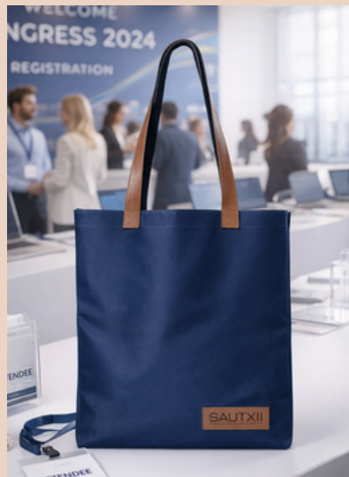
Ecobag em Nylon com etiqueta de couro sintético em Baixo Relevo

Exemplos: Etiquetas aplicadas em todo tipo e modelos de bolsas.