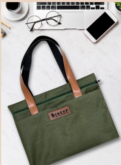
Ecobag em Nylon com Etiqueta em couro sintético gravada em laser.

Exemplos: Etiquetas aplicadas em todo tipo e modelos de bolsas.