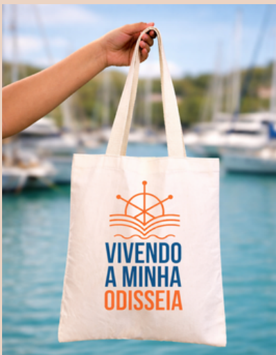
Ecobag em Algodão com impressão em serigrafia 2 cores.

Exemplos: Ecobags em algodão, brim ou TNT. Impressão 1 a 2 cores.