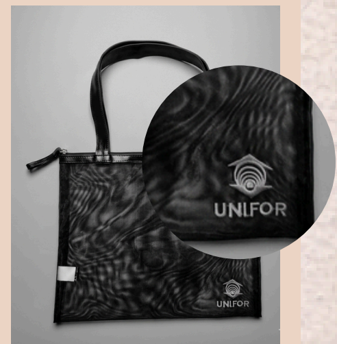
Pasta em tela de poliéster com logo aplicada em bordado.

Exemplos: Pelo alto custo, aplica-se pequenos detalhes, como logomarcas.