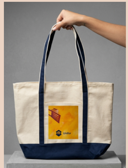
Bolsa Premium em Algodão com impressão em DTF

Exemplos: Ecobags em algodão com impressão artísticas ou bem coloridas.