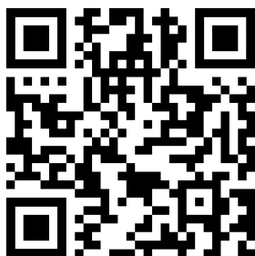
QR-Code Google Bewertung

Falls Sie mit unserer Arbeit zufrieden waren, würden wir uns sehr über eine positive Google Bewertung über den QR-Code (unten links) freuen. Vielen Dank!