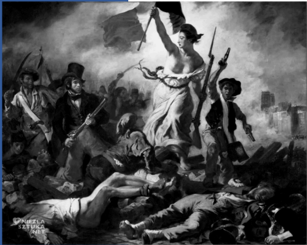
La Libertad guiando al pueblo (1830). Autor: Eugène Delacroix.