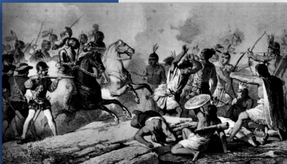
Hernán Cortés y sus caballeros en la “Masacre” de Tabasco. Grabado histórico del siglo XIX