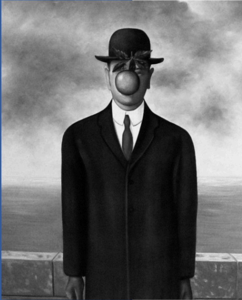
El hijo del hombre (1964). Autor: René Magritte.