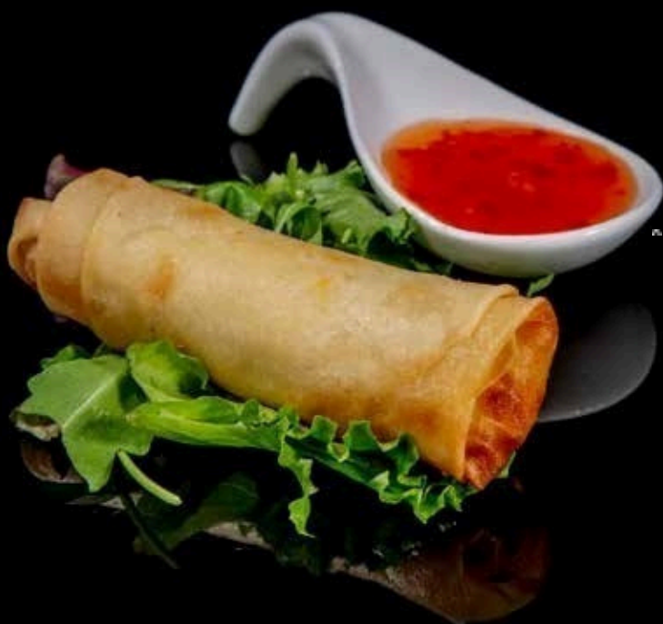
Involtini primavera 2pz

croccante involtino fritto di pasta sfoglia con un gustoso ripieno di verdure