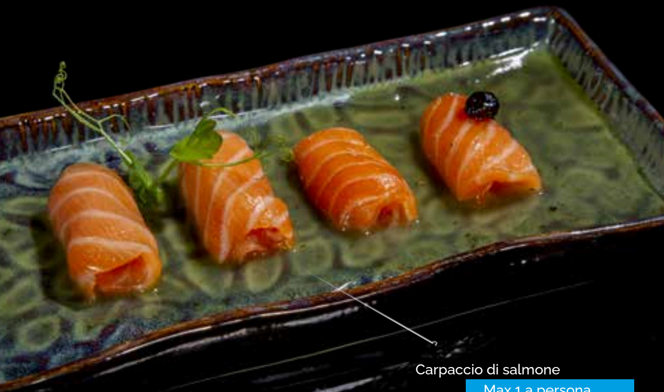
Carpaccio di salmone