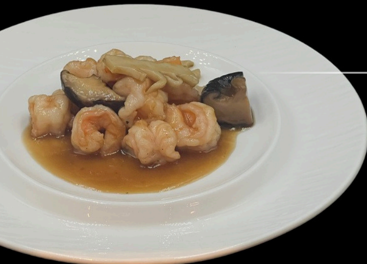
Gamberi* funghi e bambù

gamberi* saltati con funghi, bambù € 7,50