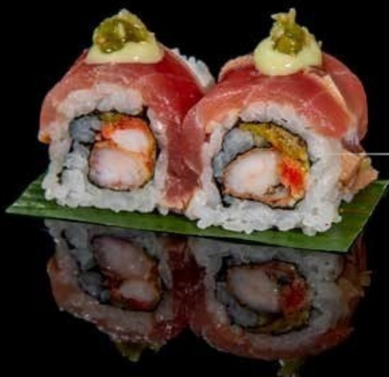
Zuke maguro roll 4pz

gamberi* fritti, fiore di zucca in tempura, esterno tonno marinato, crema di wasabi e wasabi fresco € 7,00 Allergeni: 1,2,3,4,6,10