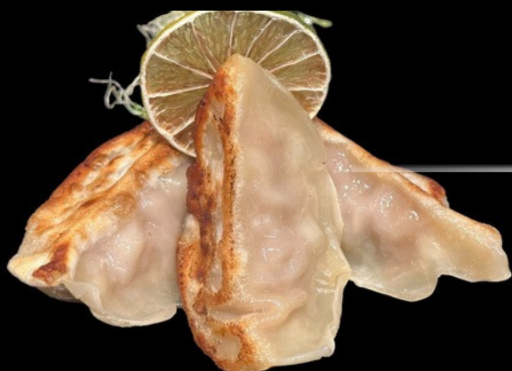
Ravioli Piastra 3pz

Ravioli carne di maiale e verdure miste alla piastra €4.00