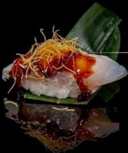
Nigiri suzuki scottato 1pz

branzino scottato, salsa teriyaki e kataifi