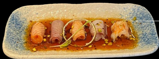
Carpaccio Mix Flambe pesce misto scottato , pistacchio salsa ponzu wasabi €5.00