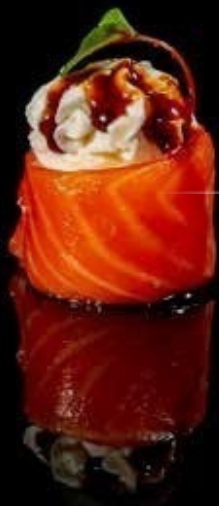
Gunkan philadelphia 1pz

salmone, philadelphia e salsa teriyaki € 2.00 Allergeni: 1,4,6,7