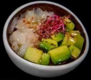
Tartare di amaebi

tartare salmone, sesamo e salsa ponzu € 6.00 Allergeni: 1,4,6,11