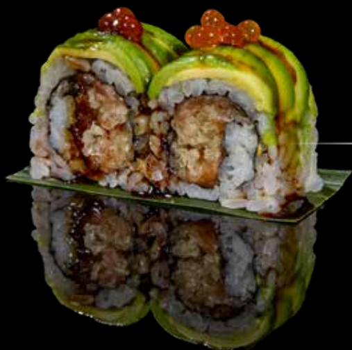
Monster roll 4pz

roll con farina di tempura esterno avocado, ikura* e salsa teriyaki € 5,00 Allergeni: 1,4,6