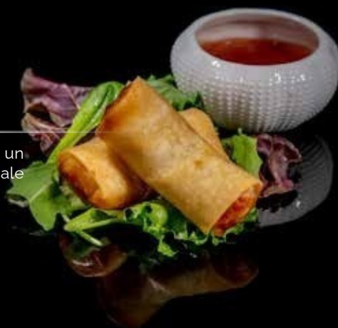
Ebi Shrimp 2pz

Gamberi kataifi , salsa agropiccante €8,00