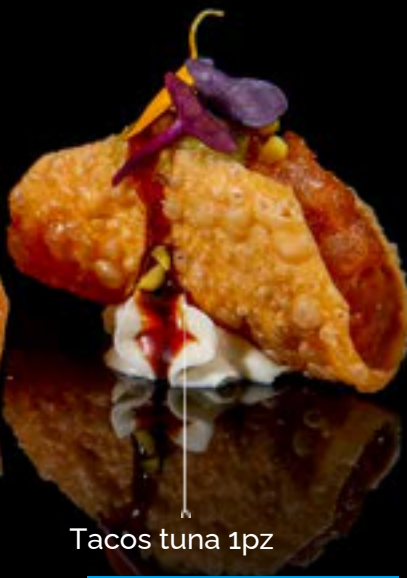
Tacos tuna 1pz