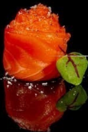
gunkan salmon love 1pz

salmone, philadelphia e salsa teriyaki € 2.00 Allergeni: 1,4,6,7