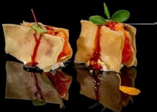
Mille foglie salmone 1pz