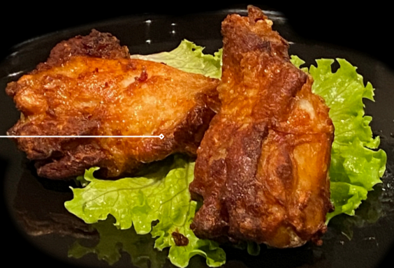
Alette di pollo 2pz Fritto €4.50