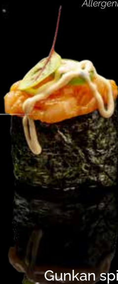
Gunkan spicy tuna 1pz

salmone, spicy maionese, tobiko* e shichimi € 2.00 Allergeni: 3,4,10