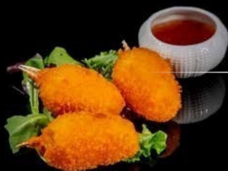
Chele di granchio* 3pz