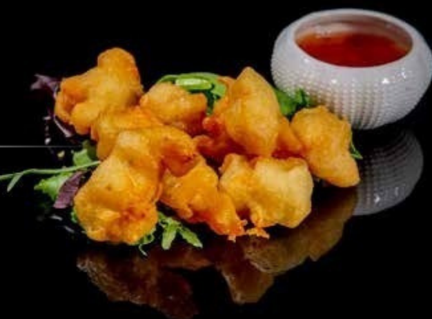
Cotoletta di pollo

croccante frittura di pollo impanato € 4.00 Allergeni: 1