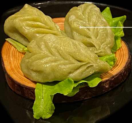
Ravioli Verdure 2pz €3.50