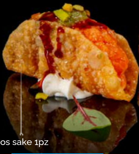
Tacos sake 1pz