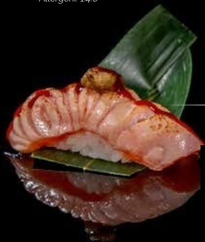
Nigiri sake & foie gras 1pz