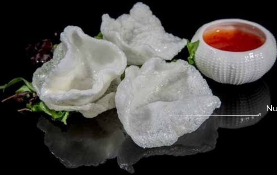
Nuvole di gamberi*