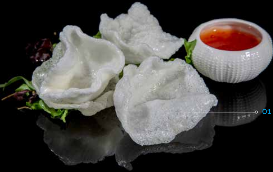
01 / Nuvole di gamberi*