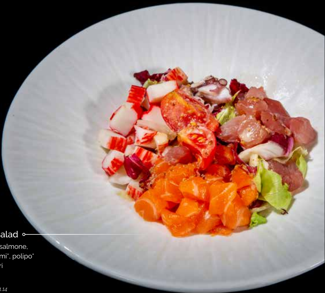
30 / Kaisen salad ◦

insalata al salmone, tonno, surimi*, polipo* e pomodori