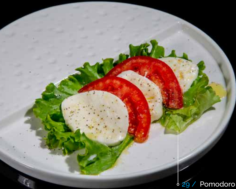
29 / Pomodoro e mozzarella 🌿