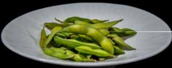
05 / Edamame* 🌿