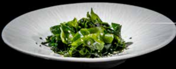
03 / Wakame* 🌿