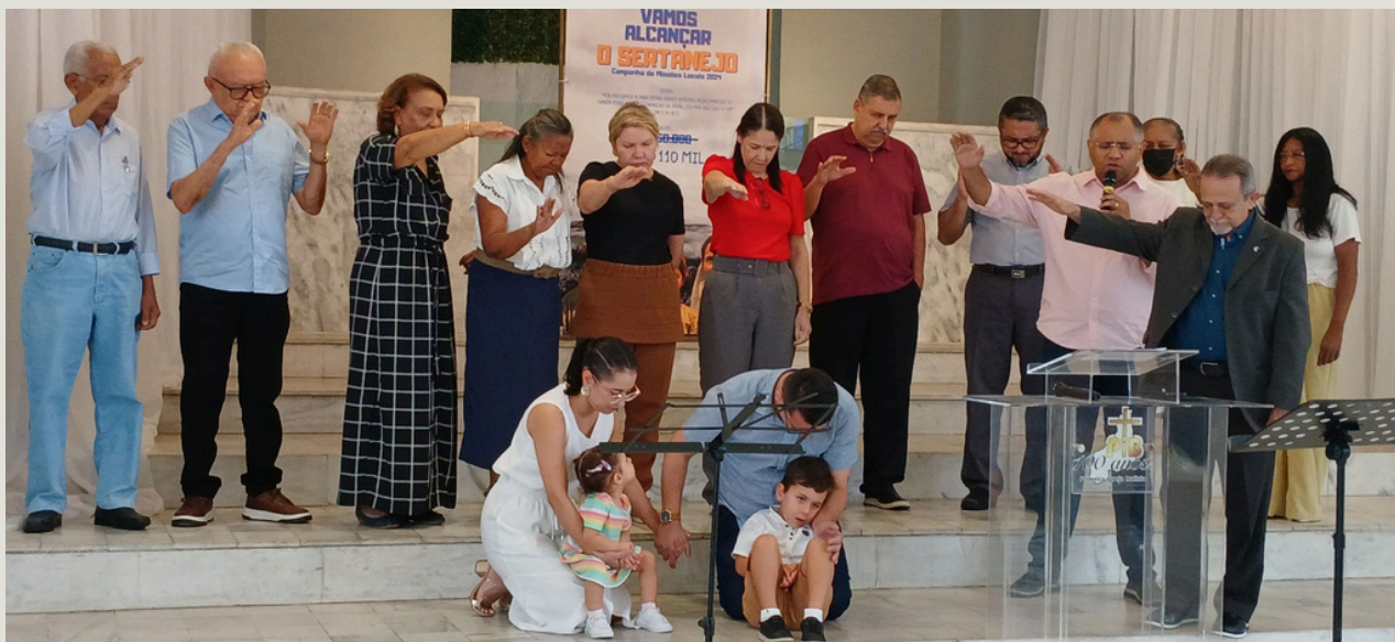
Foto 7. Envio pela PIB TERESINA