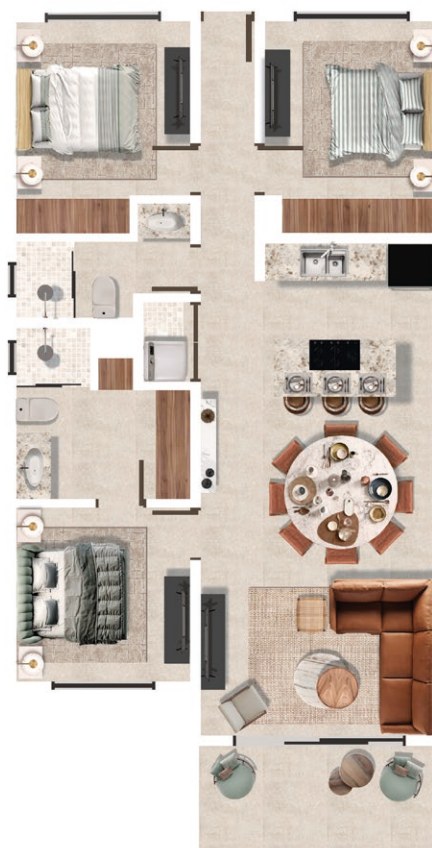
Nivel 2, 3 y 4