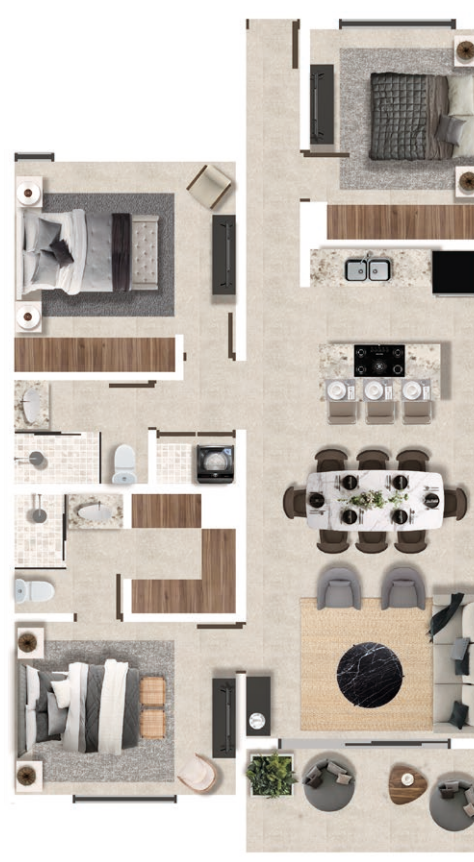
Nivel 2, 3 y 4