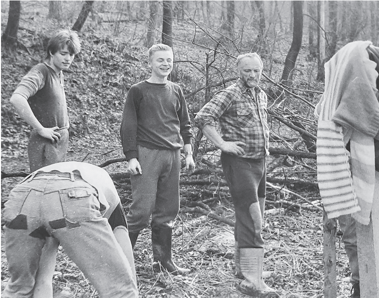
Siegfried mit Schülern seiner Jugend AG Anfang der 1980er Jahre, Foto: Archiv S. Rein.

geprägten Werdegang und standen mit ihm in freundschaftlicher Verbindung. Seine ersten wissenschaftlichen Erkundungen waren noch auf Amphibien und Fledermäuse ausgerichtet. Als er 1980 mit dem Naturkundemuseum Erfurt (bzw. den damaligen „Rudimenten“ des Museums) Kontakt aufnahm, begannen ab 1983, ausgehend von den ersten Funden in der Baugrube des eigenen Hauses, seine Interessen mehr und mehr in die Paläontologie umzuschwenken. In seiner konzentrierten und tiefeschürfenden Art näherte er sich den Ceratiten des Germanischen Muschelkalkes.