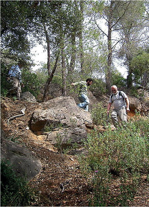
Auf Exkursion im Hinterland Mallorcas 2008, Foto: Sebastian Brandt.

Bei den mehrfachen Exkursionen des TVT in den Oberen Muschelkalk des Weserberglandes wurde Siegfrieds verknüpfende und manchmal durchaus polarisierende Wesenheit besonders deutlich. Es waren wunderbare Tage in der Gemeinschaft von Freunden aus fünf Bundesländern, jeder mit seinem eigenen Zugang zum Thema Muschelkalk, die dort nach seiner