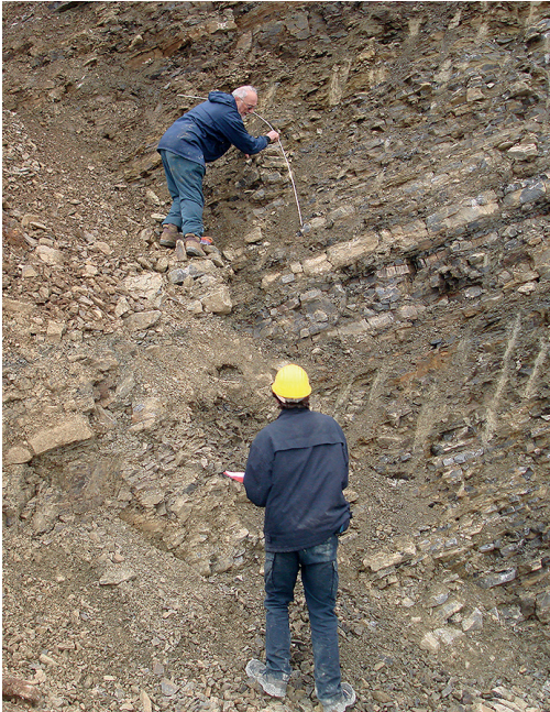
Profilaufnahme in Troistedt, Foto: Jörg Amling.

Muschelkalkmeer. Durch den engen Einbezug des Naturkundemuseums Erfurt und des Naturhistorischen Museums Schloss Bertholdsburg Schleusingen entstand somit die größte und bedeutendste Muschelkalksammlung (insbesondere für Cephalopoden) weltweit, eine beeindruckende Publikationsliste und eine völlig neue Perspektive zu den biologischen, geologischen und evolutiven Vorgängen innerhalb jenes verschwundenen Lebensraums.