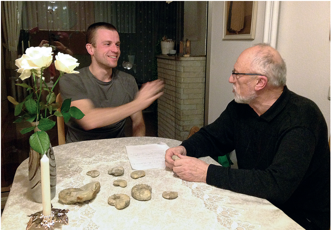
S. Brandt im freundschaftlichen Gespräch mit dem Autor Anfang 2000er Jahre, Foto: Archiv S. Rein.

So gelangte auch der Erstautor als Ceratiten sammelnder Schüler Mitte der neunziger Jahre an den dann langjährigen väterlichen Freund. „Ich weiß noch mit welcher Ehrfurcht ich ihm meine ersten Präparationsergebnisse vom elterlichen Balkonarbeitsplatz zeigte und mit welcher Hingabe er mich mit meiner Begeisterung aufnahm und mich förderte. Es folgten viele Jahre tiefgründiger Gespräche am Reinschen Kaffeetisch mit Kuchen, Spezereien und gesalzenen Butterbrötchen, grübelnd, humorvoll, manchmal auch frustrierend und resignierend im Angesicht der ignoranten Haltung einiger sogenannter Fachkollegen. Es war immer eine