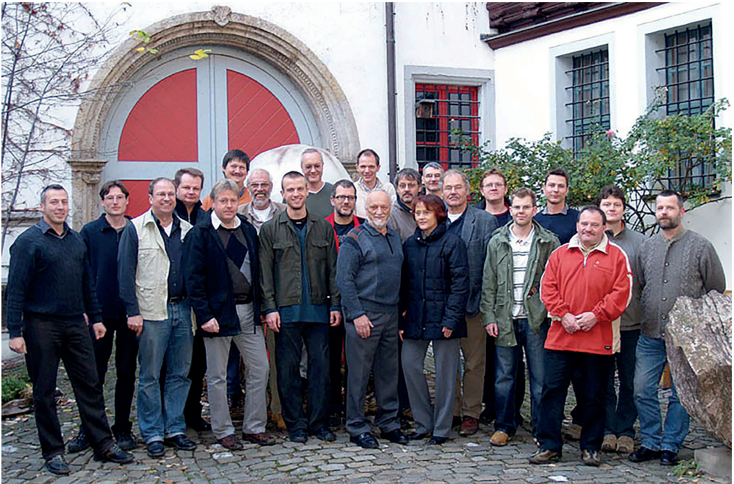
Der Trias-Verein-Thüringen e.V. 2003, Foto: Archiv Trias Verein Thüringen e.V.

wirkliche Herausforderung Siegfrieds visionären und doch immer sachlich fundierten Ideen und Erkenntnissen zu folgen und ihm mit zunehmender Erfahrung ein konstruktiver Dialogpartner auf Augenhöhe zu sein.