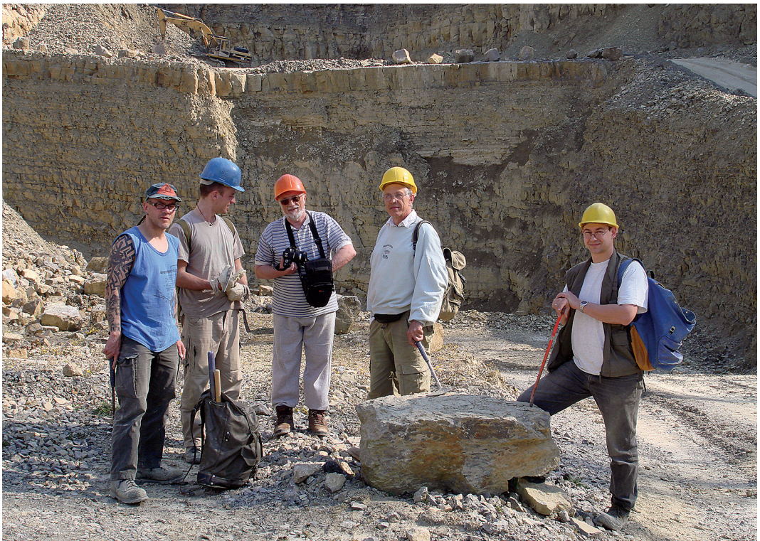
Mit dem TVT im Weserbergland 2006, Foto: Robert Ernst.

Um Siegfried als warmherzigen, energisch arbeitenden Menschen zu charakterisieren, sollen aus der Fülle der gemeinsamen Erlebnisse einige des Erstautors aufgeführt werden.