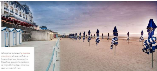
Cette que l'on surnomme "La plage des romantiques" est aussi manifestement la mieux fréquentée pour faire découvrir les littéraires, ressusciter les standards de l'époque, aller en sautoir et les réchauffer après une course effrénée.

Longue de 4 km, la plage de sable fin de Cabourg est l'endroit idéal pour profiter des bienfaits de la mer. Bordée d'une promenade entièrement piétonne, elle offre des paysages qui se teintent de diverses couleurs au gré des saisons et du temps