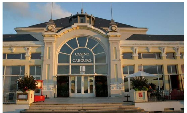
Le casino de Cabourg