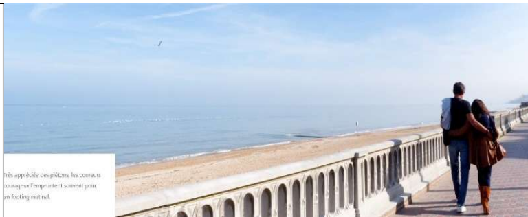
Très appréciée des piétons, les coureurs courageux l'empruntent souvent pour un footing matinal.

Longue de 4 km, la plage de sable fin de Cabourg est l'endroit idéal pour profiter des bienfaits de la mer. Bordée d'une promenade entièrement piétonne, elle offre des paysages qui se teintent de diverses couleurs au gré des saisons et du temps