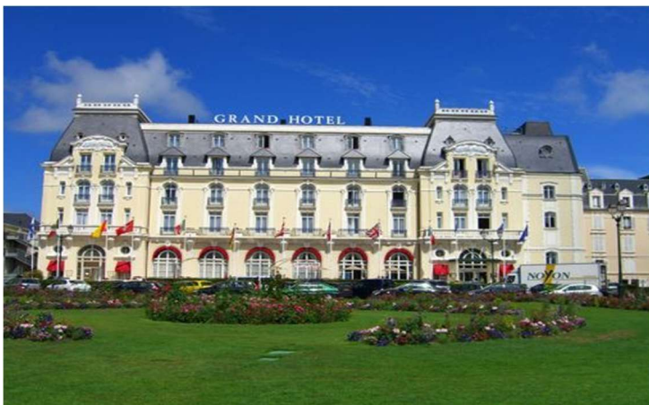
Le Grand Hôtel