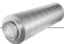
SDS I Duct silencer, rigid