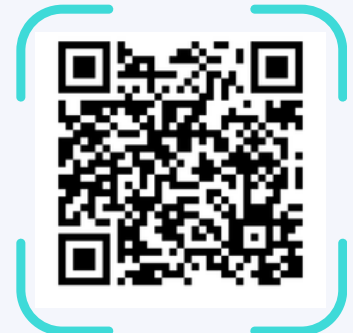
Pago con PayPal