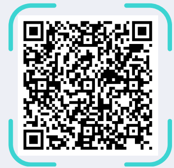
Formulario de inscripción

3 Espera la confirmación de pago por correo electrónico, con los datos para el acceso al curso.