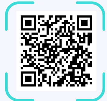
Pago con PayPal