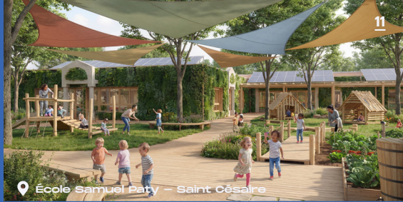
École Samuel Paty – Saint Césaire