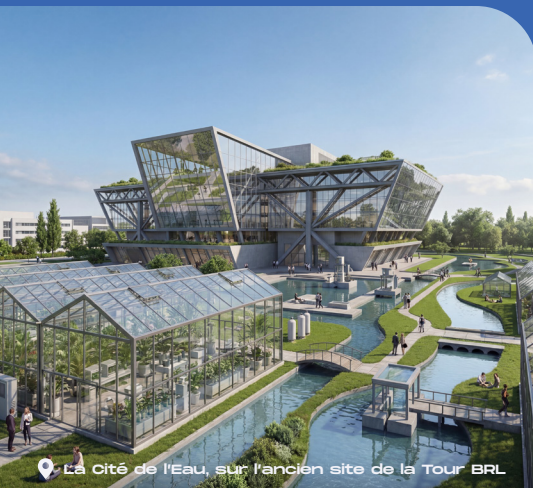
La Cité de l'Eau, sur l'ancien site de la Tour BRL

C'est aussi une ville fière de ses traditions, audacieuse dans la création, dynamique dans le sport et capable d'attirer talents, entreprises et visiteurs sans perdre son identité.