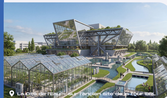
La Cité de l'Eau - sur l'ancien site de la tour BRL