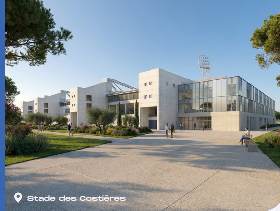
Stade des Costières