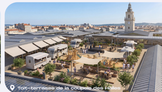
Toit-terrasse de la coupole des Halles