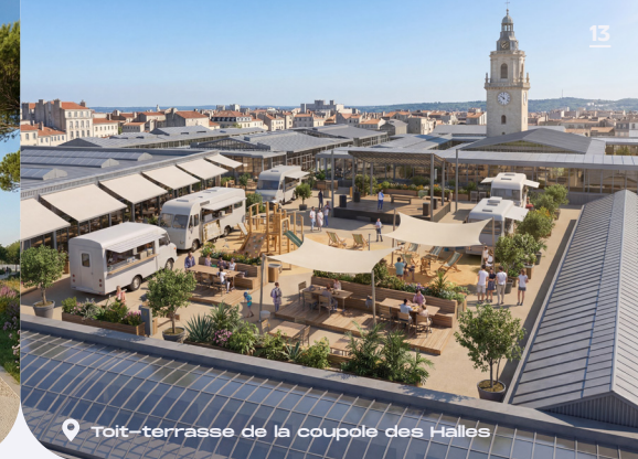
Toit-terrasse de la coupole des Halles