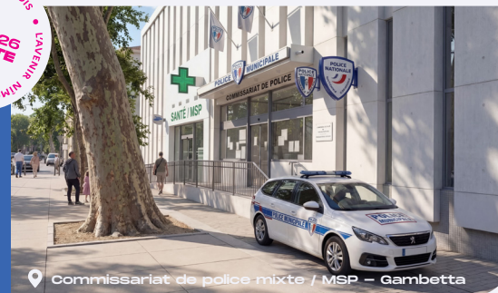
commissariat de police mixte / MSP - Gambetta

Faire de Nîmes une ville vivante, dynamique et fière de ses talents.