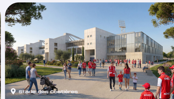
Stade des costières