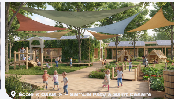
École « Oasis » - Samuel Paty à Saint Césaire