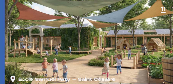
École Samuel Party - Saint Césaire