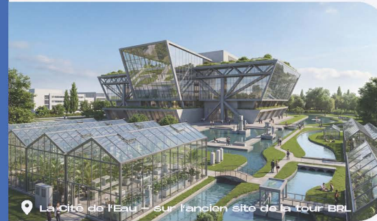
La Cité de l'Eau – sur l'ancien site de la tour BRL