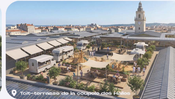
Toit-terrassé de la coupole des Halles