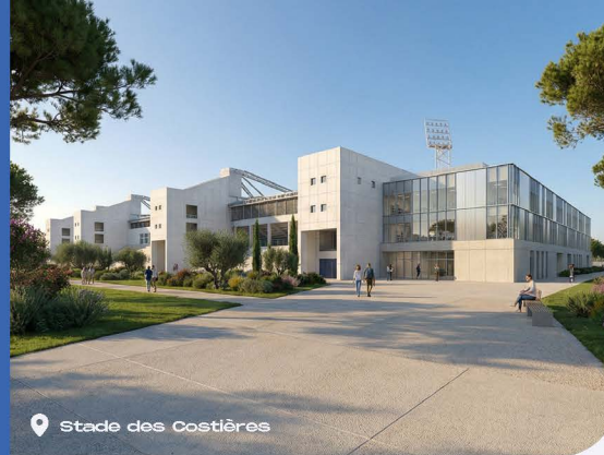
Stade des Costières