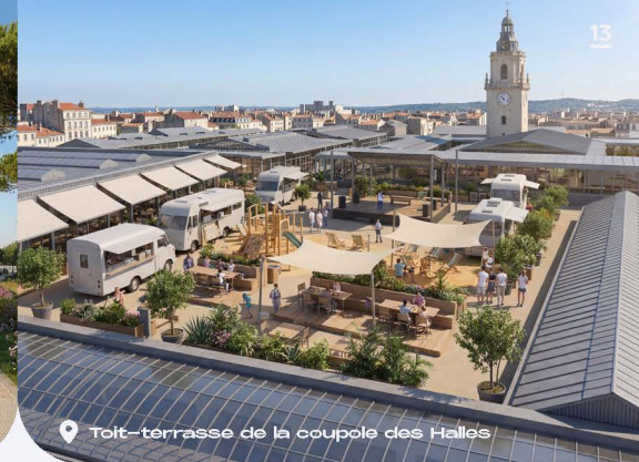
Toit-terrasse de la coupole des Halles