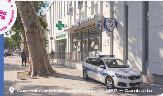
Commissariat de police mixte / MSP – Gambetta

Faire de Nîmes une ville vivante, dynamique et fière de ses talents.