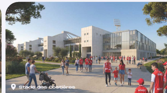
Stade des Costières