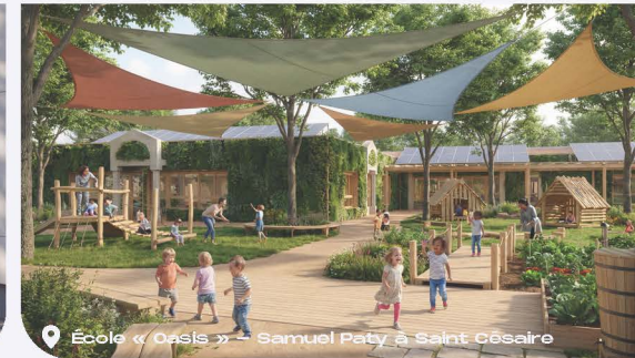
École « Oasis » – Samuel Paty à Saint Césaire