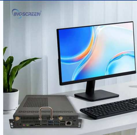
OPS PC INGSCREEN - referencia visual