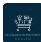
CUIDADOS INTENSIVOS A ADULTO