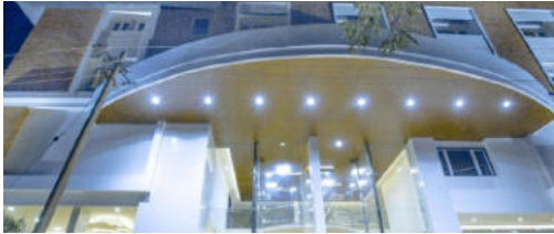
THANJAVUR Hotel Lakshmi/equivalent