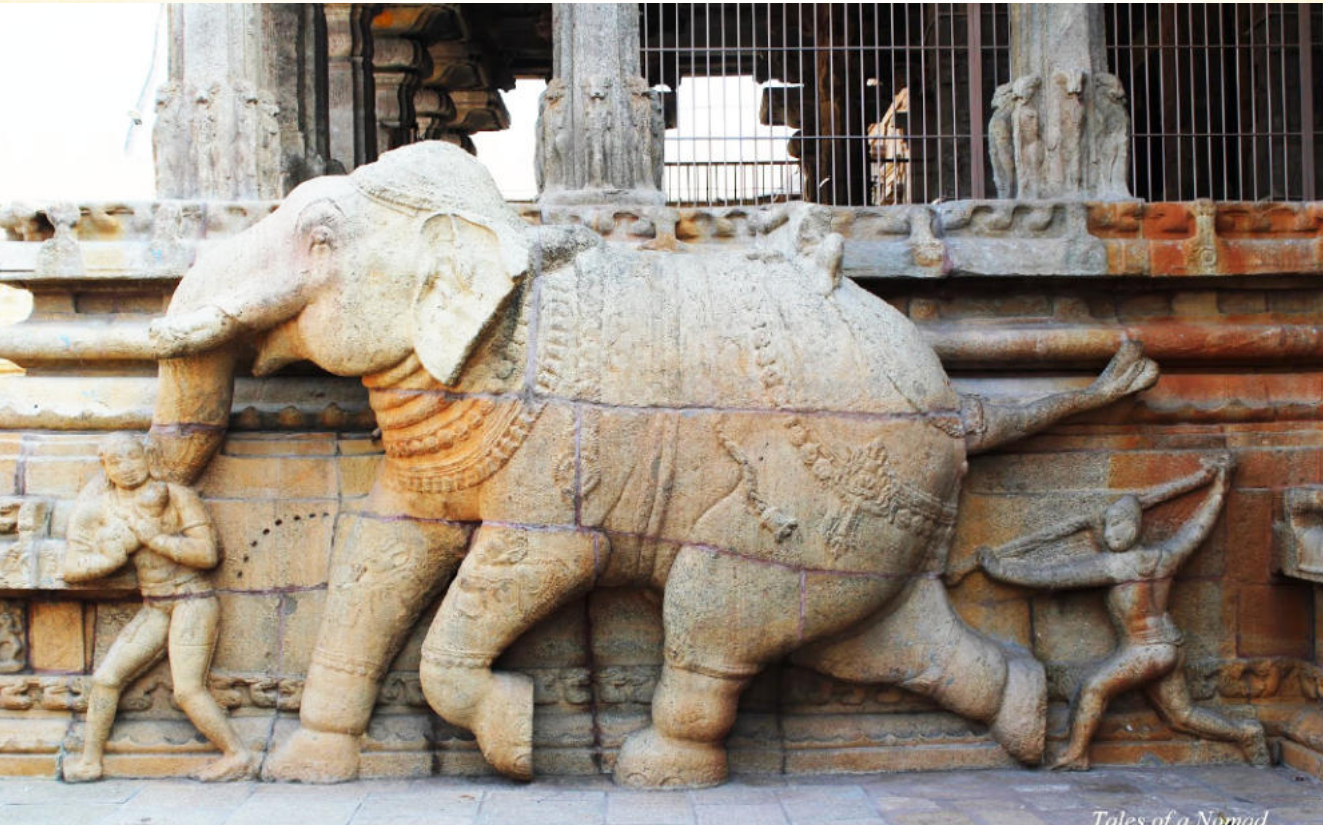
Tales of a Nomad