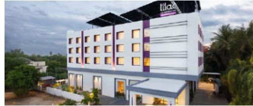
KUMBHAKONAM Hotel Lilac /equivalent