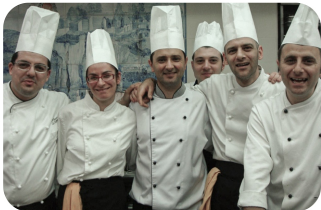
Equipe de um restaurante na Itália com estrela Michelin