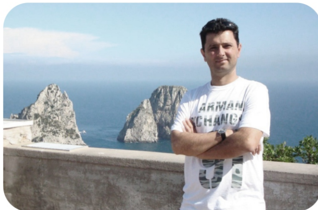
Ilha de Capri - Itália