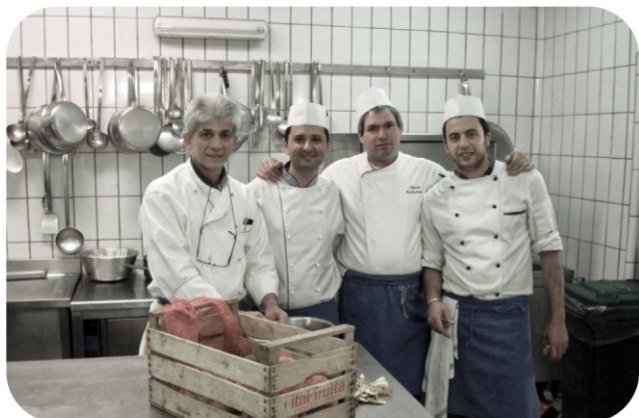
Hotel Tramontano na Cidade de Sorrento