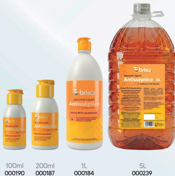
100ml 000190 200ml 000187 1L 000184 5L 000239