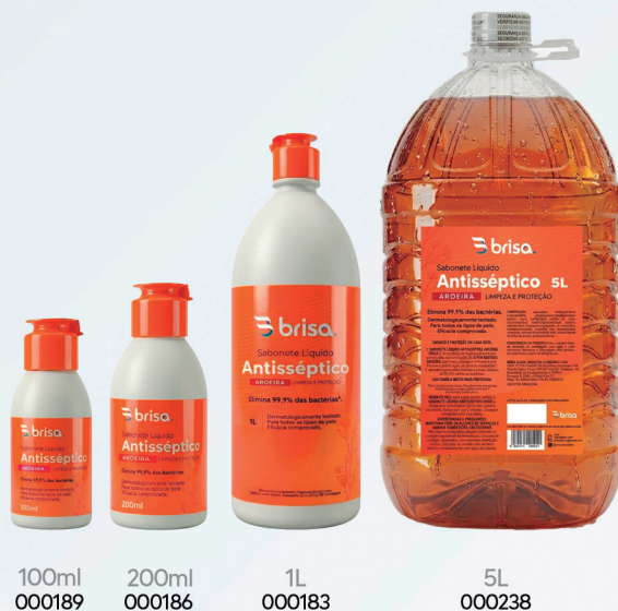
100ml 000189 200ml 000186 1L 000183 5L 000238