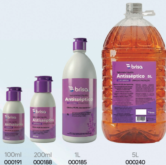
100ml 000191 200ml 000188 1L 000185 5L 000240