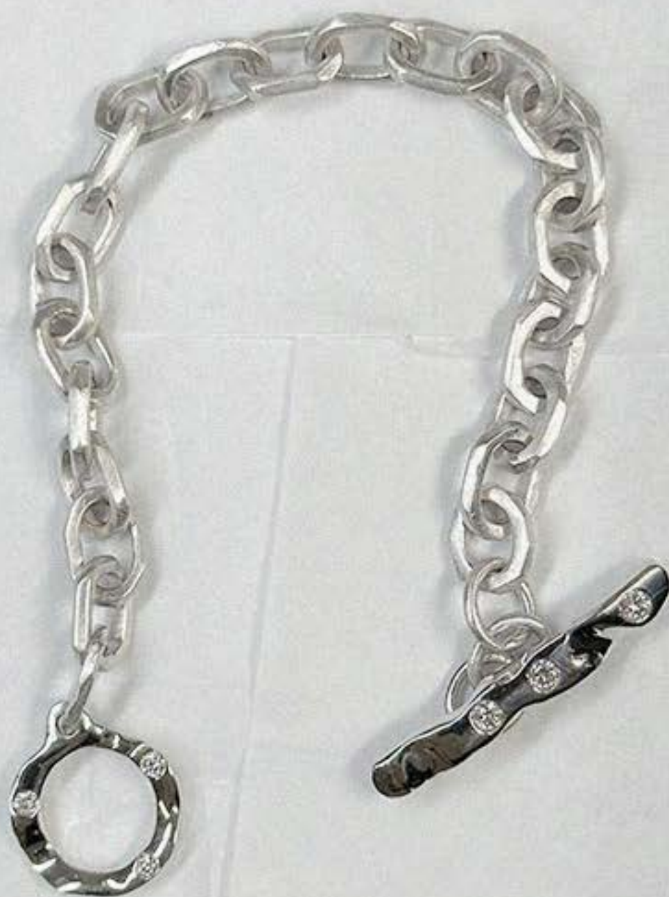
PULSEIRA STRUCTURE SYLN003