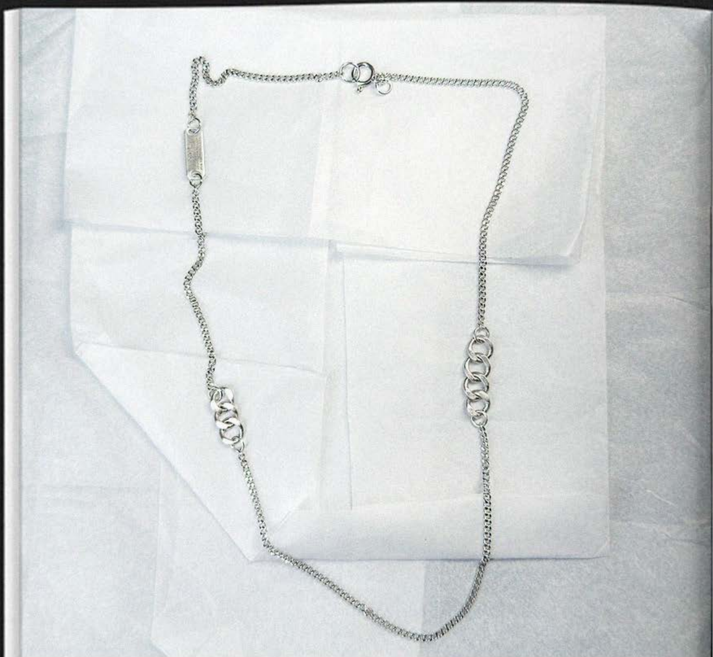
CORRENTE ELOS SYLN001