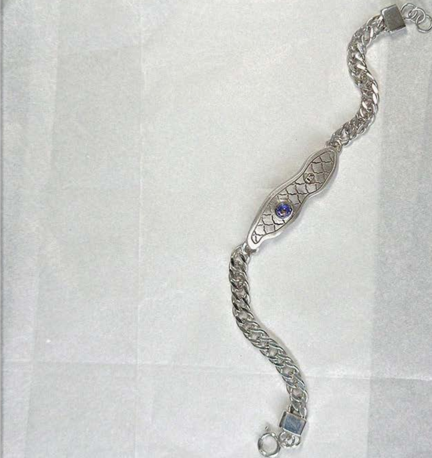
PULSEIRA HERITAGE SYLN002