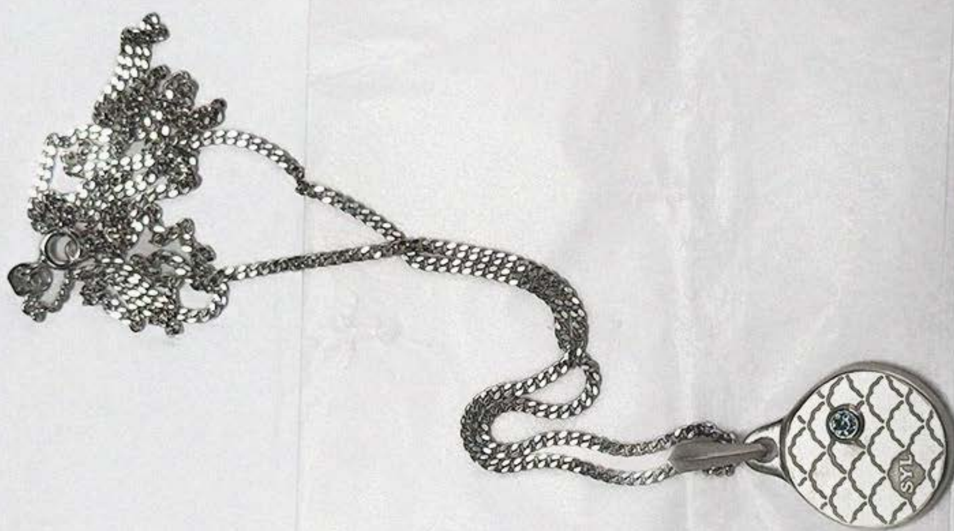
COLAR RAÍZES SYLN004