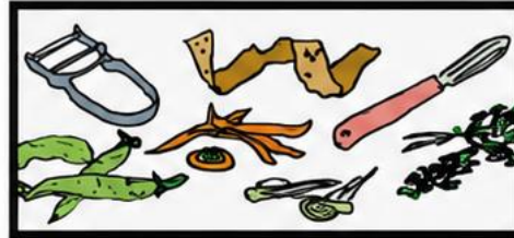
Skórki warzyw i owoców