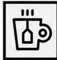
Torebki po herbacie