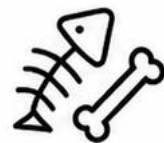
Resztek mięsa i ryb