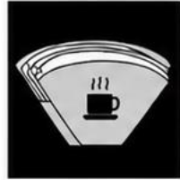
Fusy z kawy