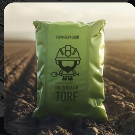
Jardín y exteriores