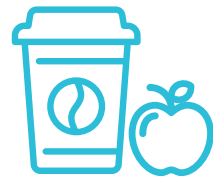
Alimentos y bebidas