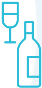
Vinos y licores