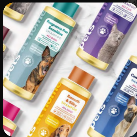
Cuidado de mascotas