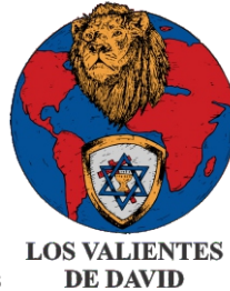
LOS VALIENTES DE DAVID