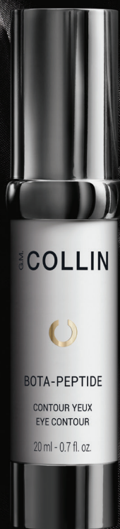
Matomos mimikos raukšlės

“ Veido mimika turi įtakos odos architektūrai. Kasdien bendraujant mes naudojame daugiau nei 15000 raumenų, kurie vėliau palieka žymes ant mūsų odos. ”