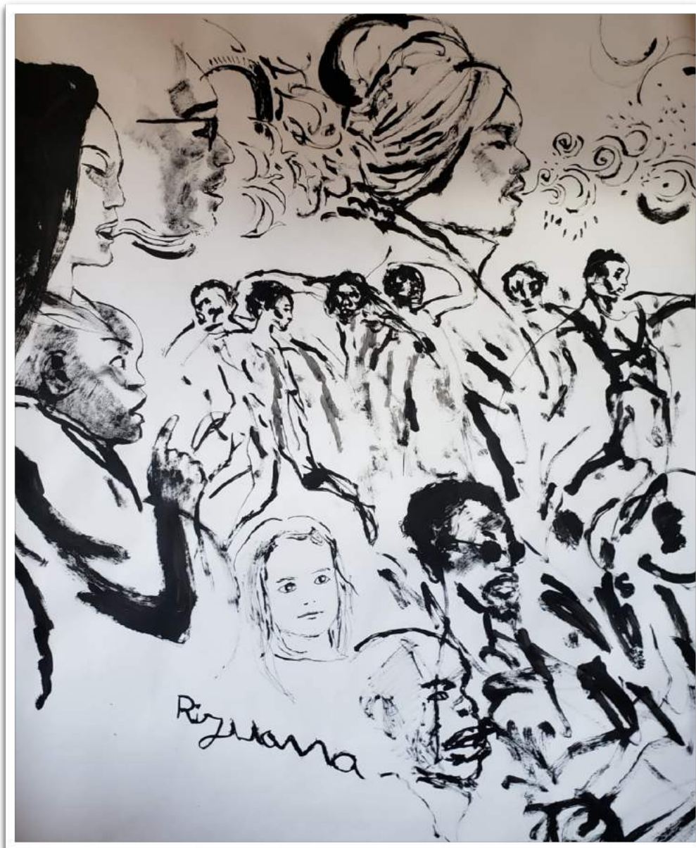
Photographie de l'impressionnante fresque réalisée par Edmond Baudoin lors des Rencontres de l'hospitalité à Autrans en mars 2019, offerte par l'artiste aux Vertaccueillants.