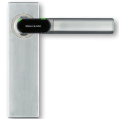
Elektronischer Türbeschlag mit Kurzschild in blinder Ausführung Electronic door Fitting with short plate in blind version