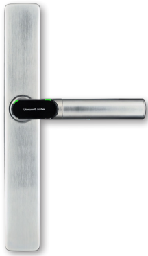
Elektronischer Türbeschlag schmal in blinder Ausführung Electronic door Fitting narrow in blind version