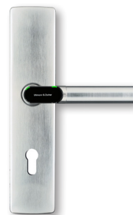
Profilzylinder Profile cylinder