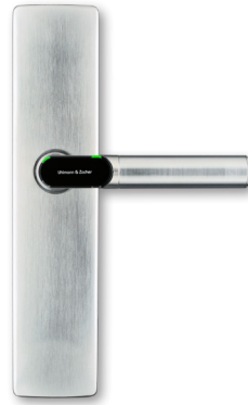
Elektronischer Türbeschlag breit in blinder Ausführung Electronic door Fitting wide in blind version