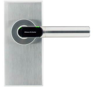
Elektronischer Türdrücker für Glastürschloss Electronic door handle for glass door locks