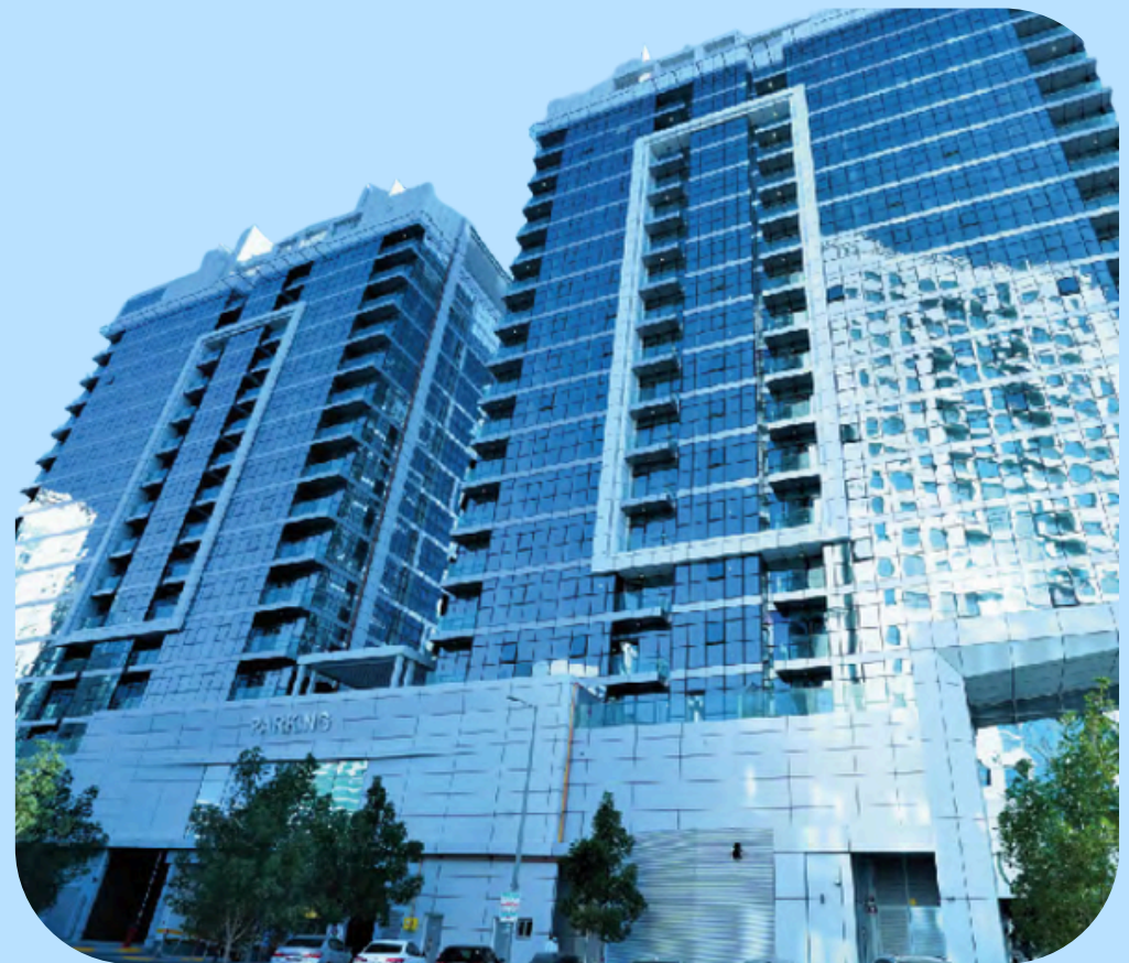
برج الريان دانيت، أبو ظبي