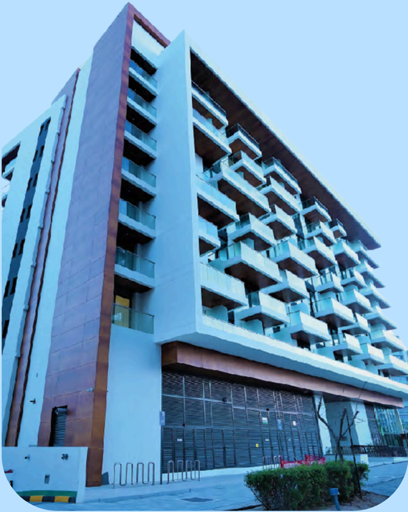
مبنى السيف المركزي لشركة ADCE شاطئ الراحة، أبو ظبي