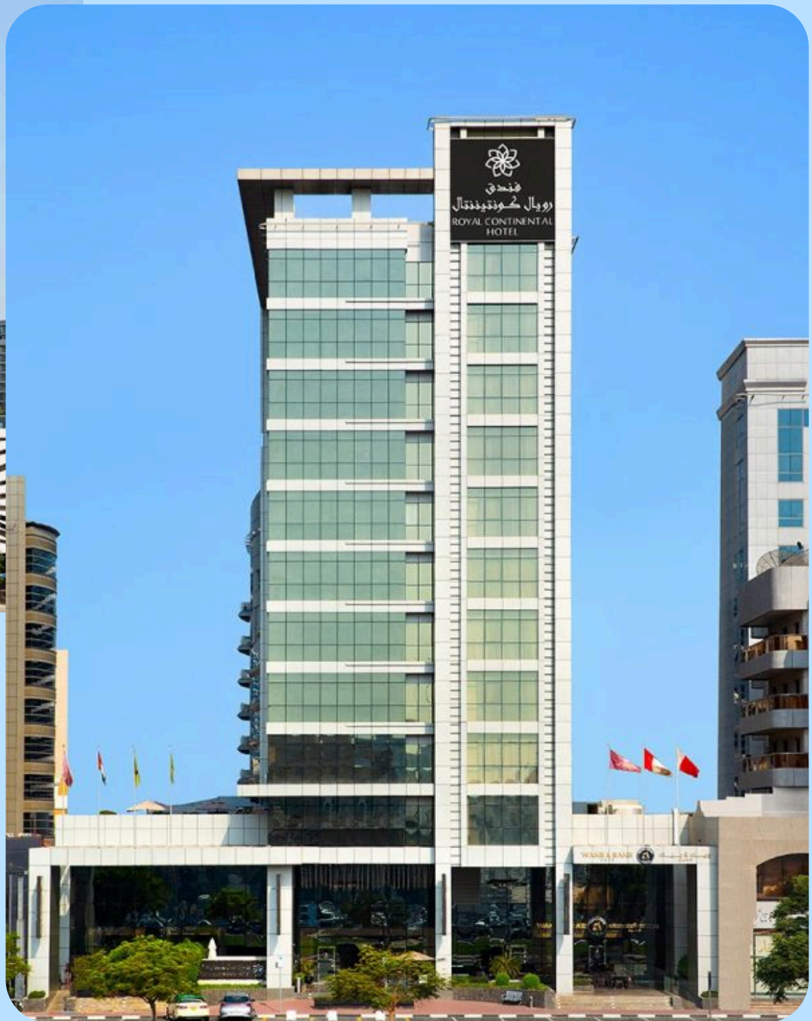
فندق رويال كونتيننتال ديرة، دبي