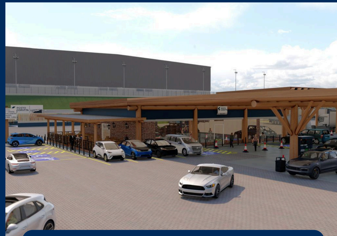
LOJA DE CONVÊNÊNCIA