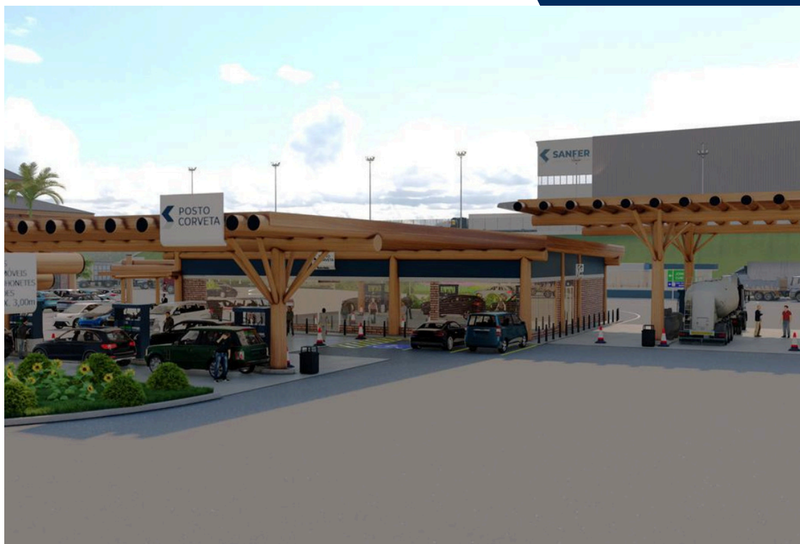
POSTO DE ABASTECIMENTO