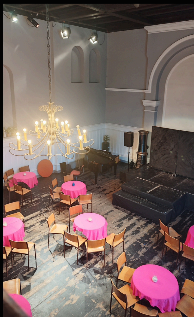
Ejemplo de montajes previos