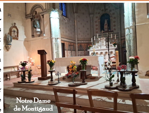
Notre Dame de Montigaud