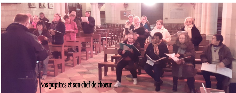
Nos pupitres et son chef de chœur