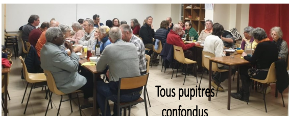
Tous pupitres confondus