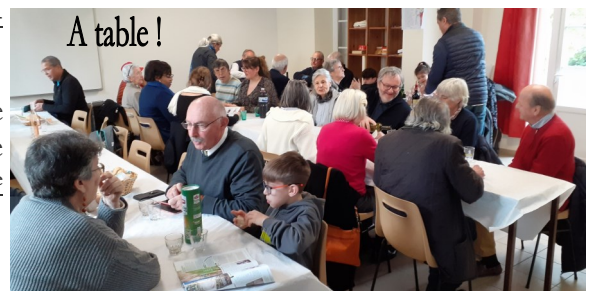
A table !

Celui, à qui il est difficile d'attribuer une année de naissance, soufflait sa 25 ème année de sacerdoce .