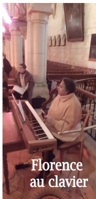
Florence au clavier