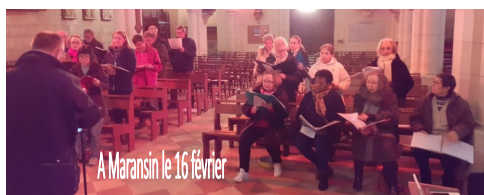
A Maransin le 16 février

Si nous entendons souvent parler de notre chorale liturgique, c'est que la trentaine de choristes avec une pianiste et deux chefs de chœur s'appliquent à répéter à raison de trois fois par semaine au Moulin d'Abzac.