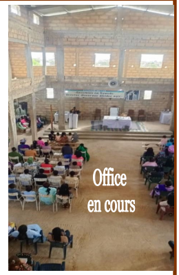
Office en cours

Grand Merci à vous de la part de la communauté sénégalaise pour votre démarche !