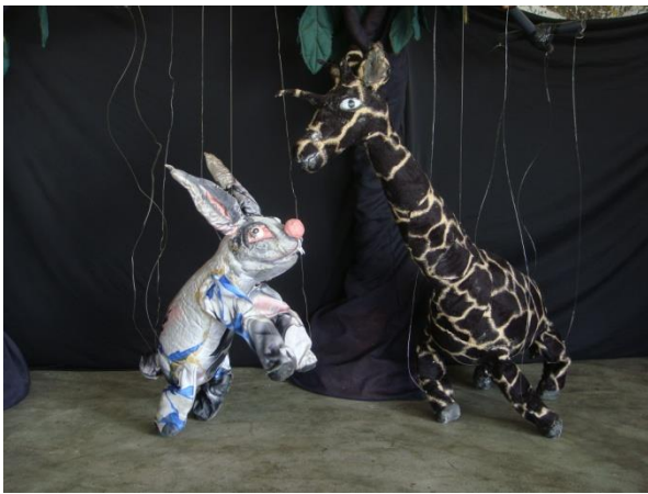
Le Lièvre, et la Girafe