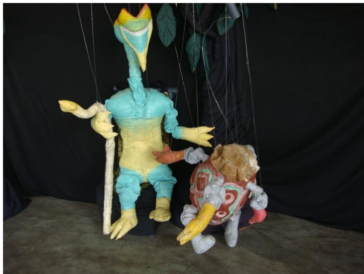
Le Roi Fantôme Et le Tambour De l'Union