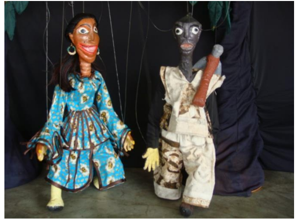
Adjoba et le Paysan