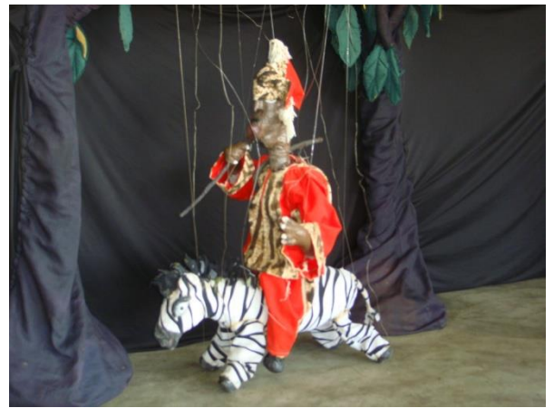
Sibiri le chasseur et le zèbre