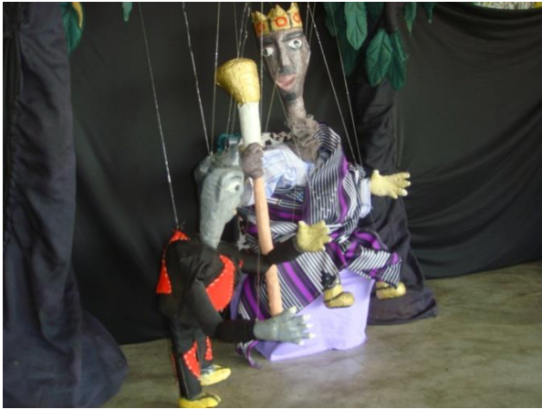
Gnanga le roi vaniteux et ziba le sorcier