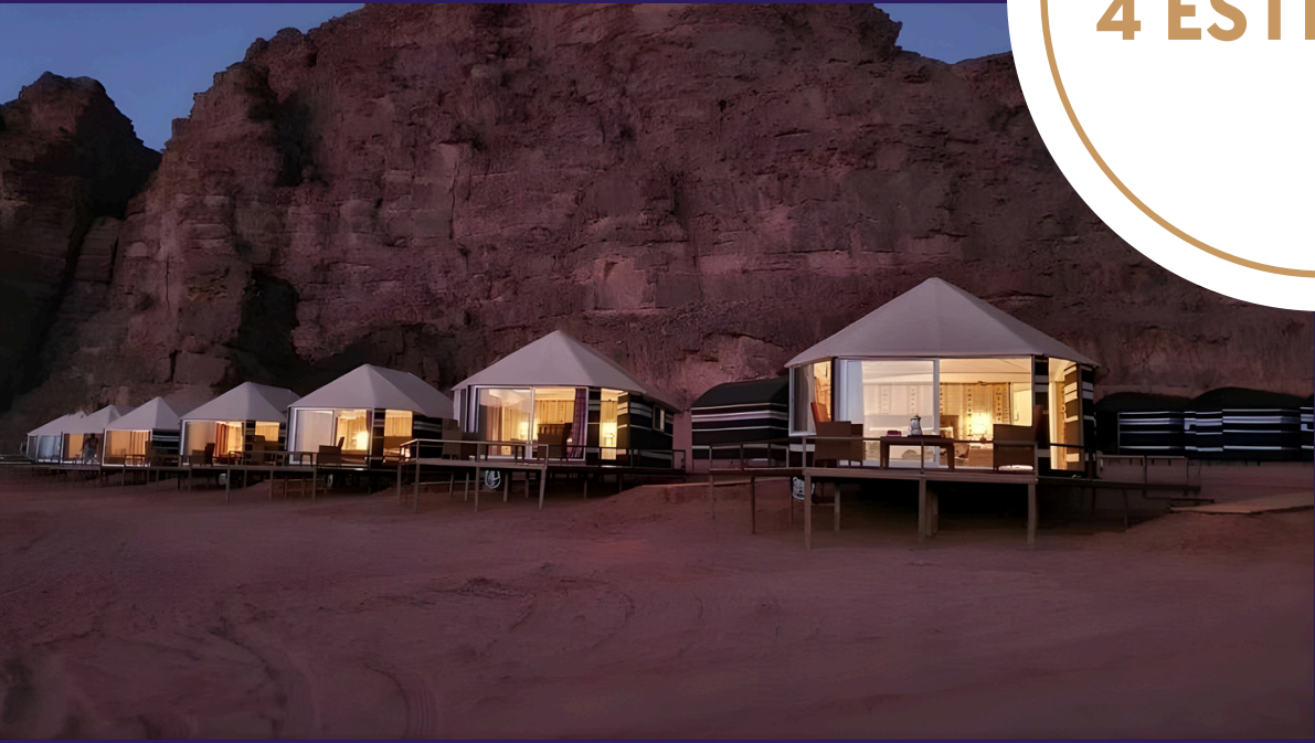
Desert Season Camp