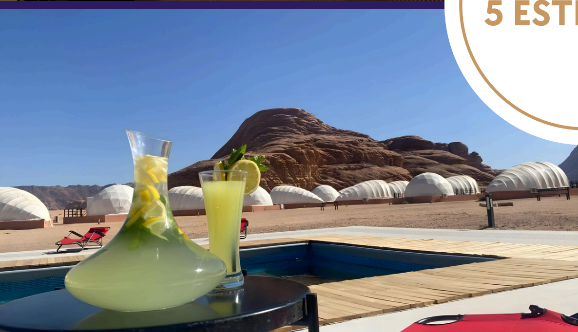
Luxury Shell Camp