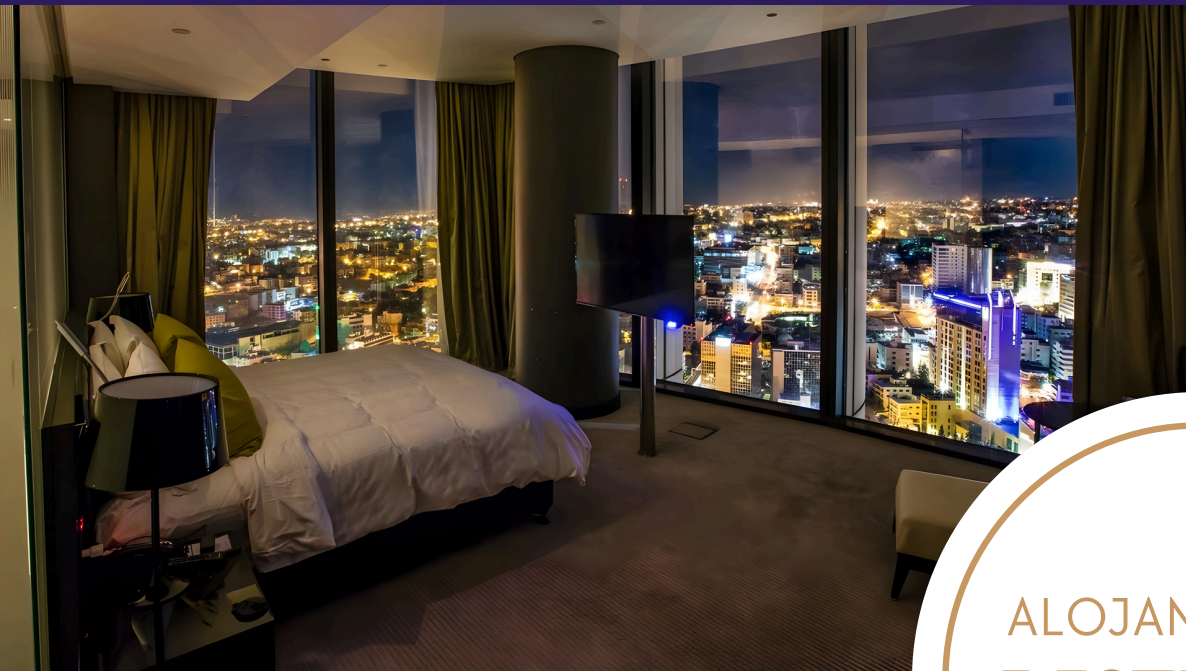
Hotel Rotana Amán