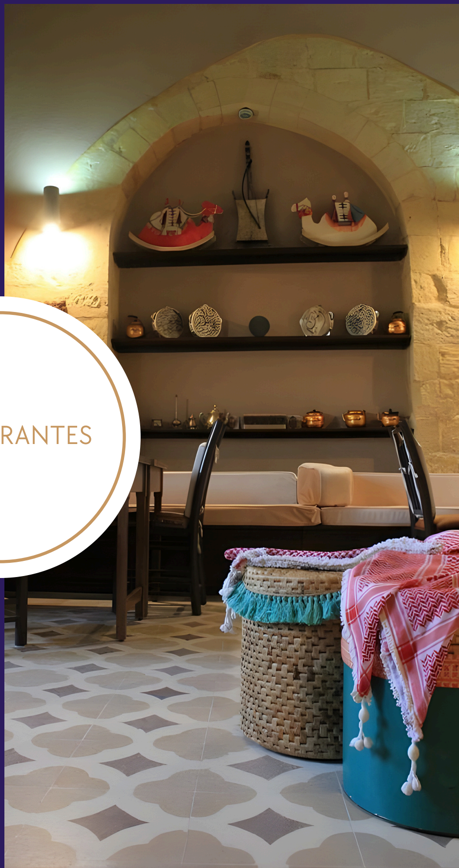
Beit Aziz Salt