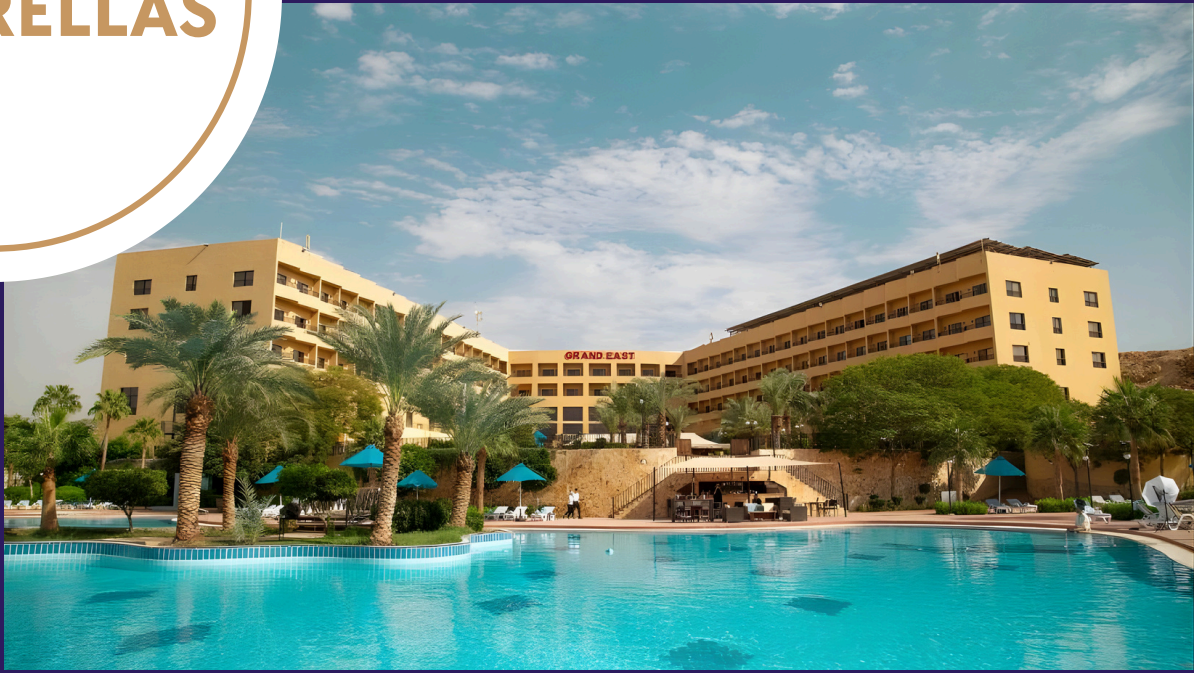
Grand East Mar Muerto