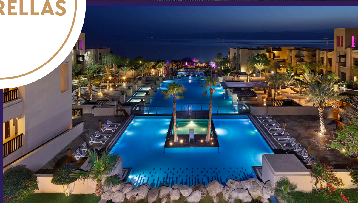
Holiday Inn Dead Sea