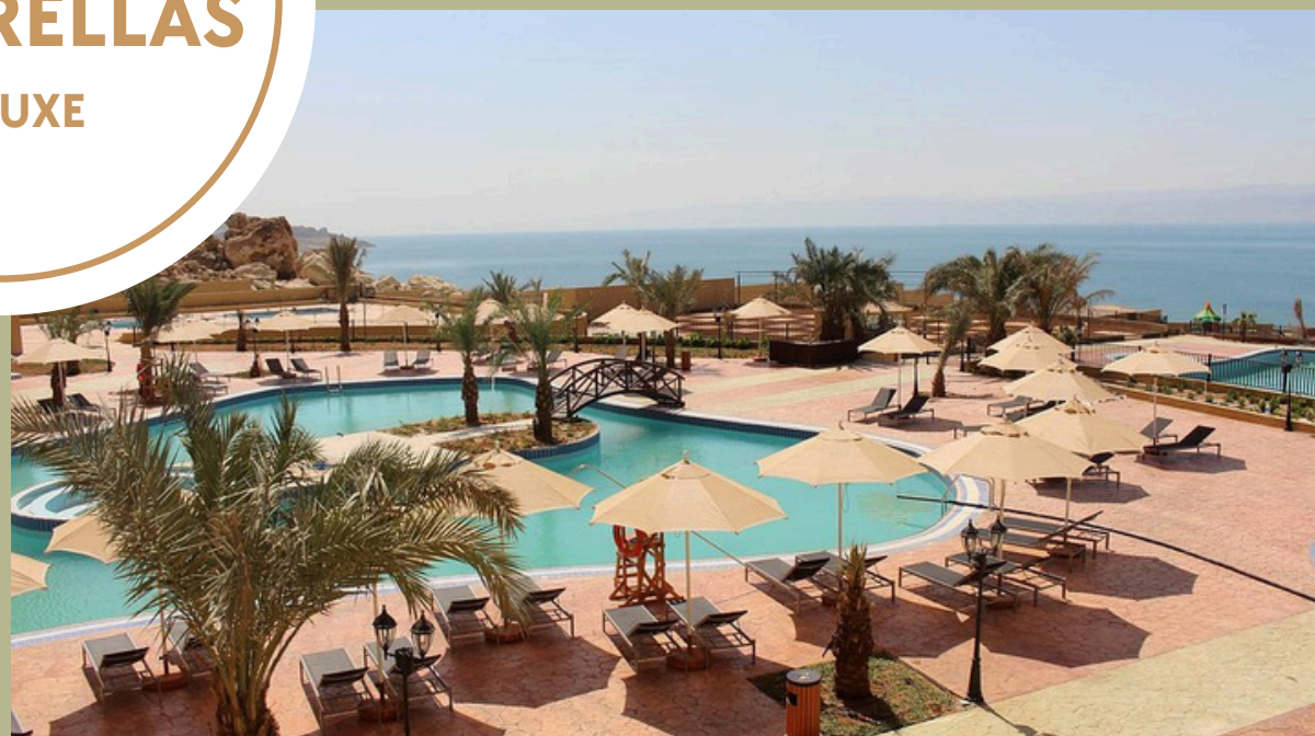
Grand East Dead Sea