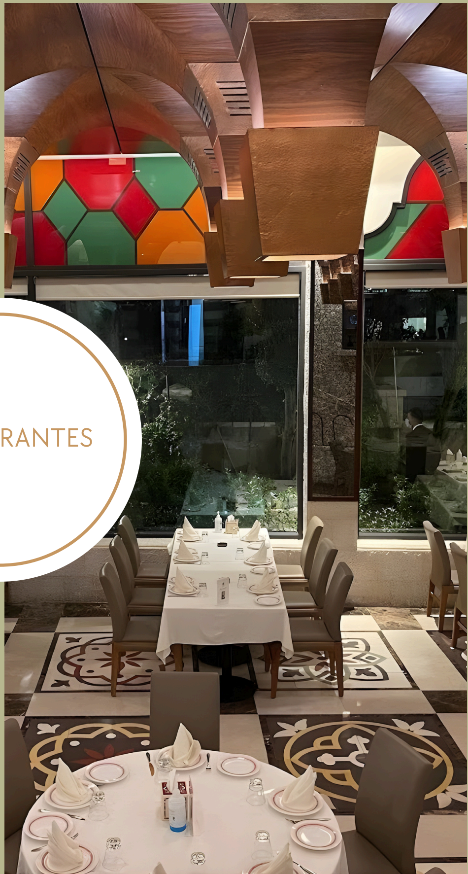
Um Khalil Amán