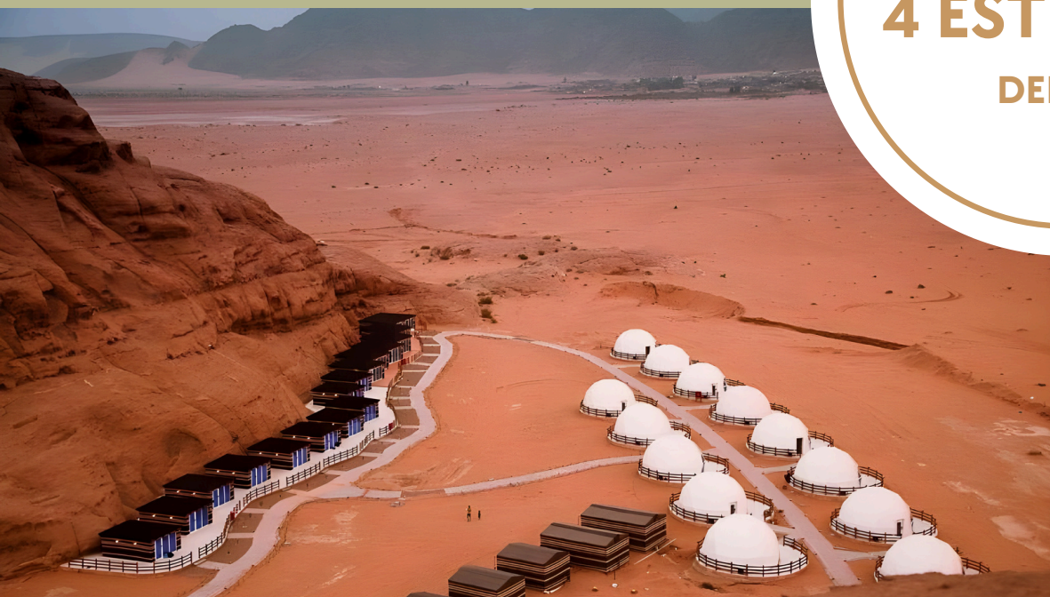
Desert Season Camp