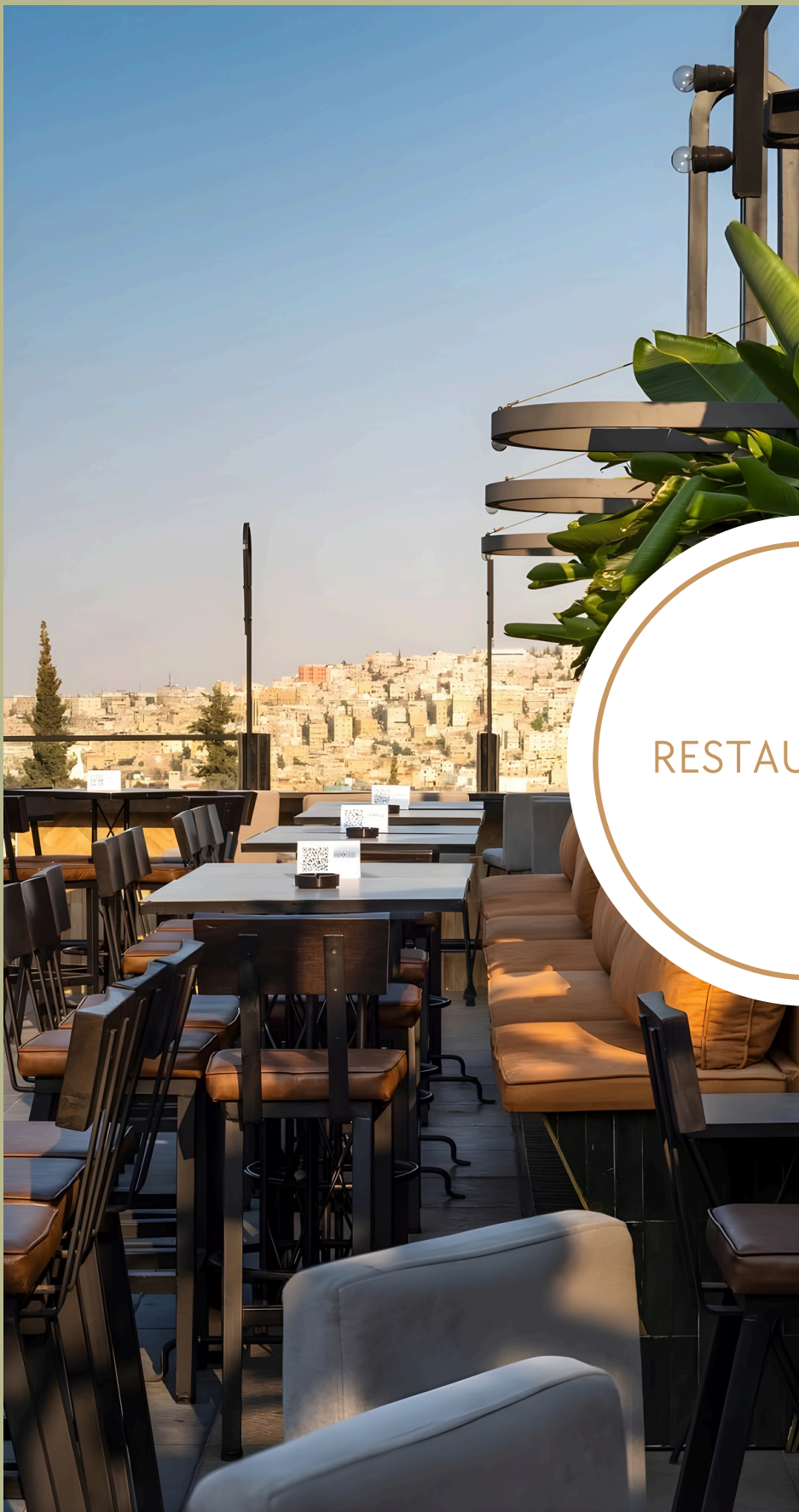
District Rooftop Amán