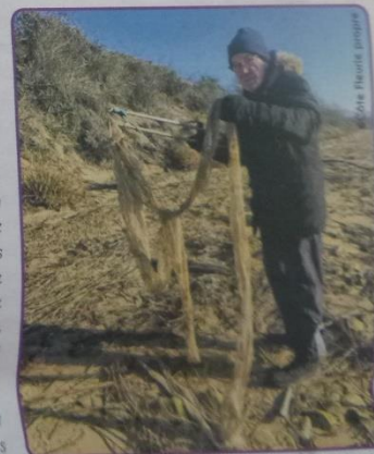
« Côte Fleurie propre »

Villers-sur-Mer et Deauville. Pour cela, il recherche là encore des bonnes volontés. Et comme pour Merville, Varaville et Cabourg, il compte aussi sur le soutien des collectivités, en leur fournissant des sacs et en ramassant le fruit de leurs collectes, les déchets ne pouvant être revalorisés compte tenu du temps passé en milieu naturel, qui plus est en eau salée. Une belle action citoyenne qui méritait bien à ces passionnés d'être nos Chouchous. Vous pouvez les suivre sur la page Facebook Côte Fleurie Propre.