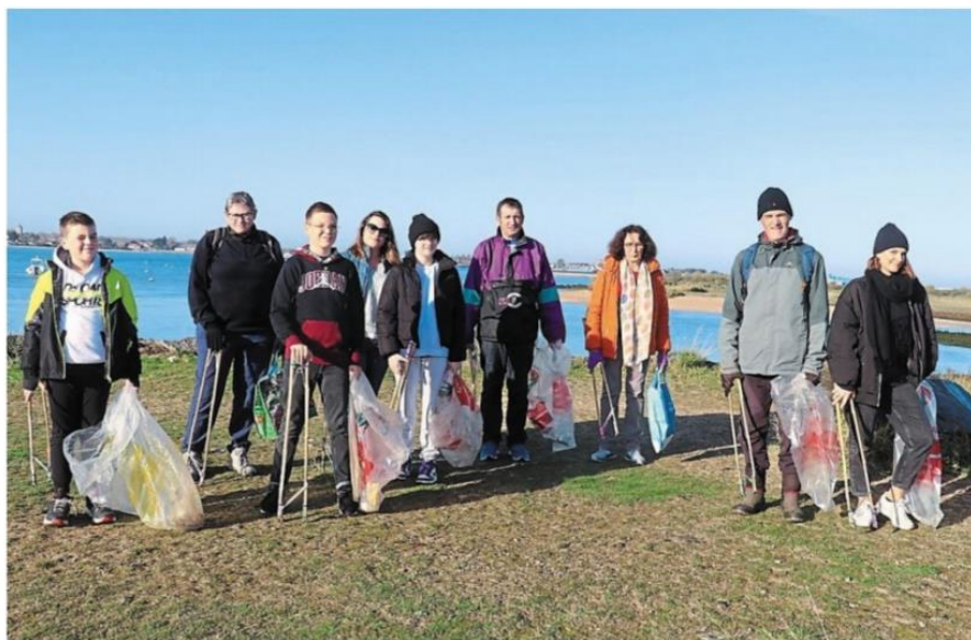
De quelques personnes à une dizaine, parfois plus, en fonction de la saison... mais c'est chaque semaine le même rituel.

L'attente se fait un peu longue. « J'ai trois personnes inscrites qui ne sont pas là. » Un coup de fil met un terme à la patience bienveillante. « Elles ne viendront pas, elles sont malades. » La distribution des pinces peut commencer. « Nous en avons fait un prototype avec l'imprimante 3D de l'EPN de Gonneville et, aujourd'hui encore, on les fabrique nous-mêmes »