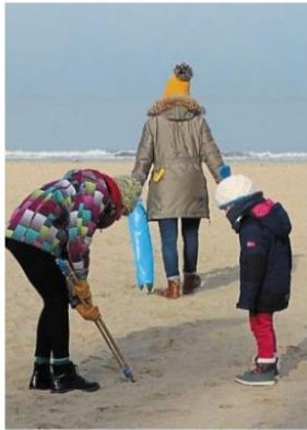
L'association Côte fleurie Propre organise des ramassages de déchets tous les mardis matin.

Une dizaine de volontaires longeait les planches et scrutaient le sable, il y a quelques jours, emmenés comme chaque semaine par Bruno Pommerat de Côte fleurie Propre.