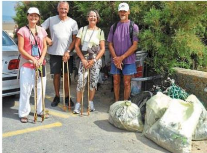
Les déchets sont aussi ramassés sur la plage de Merville-Franceville avec un certain succès.