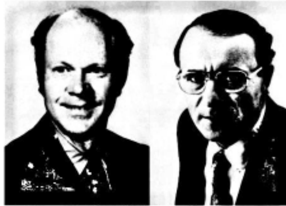
Robert Woodrow Wilson and Arno Penzias.

In science, whenever you make a prediction based on a given theory and that prediction is confirmed, it strengthens the theory. This was exactly what happened with cosmic background radiation. It was a point for the Big Bang, which now achieved total supremacy