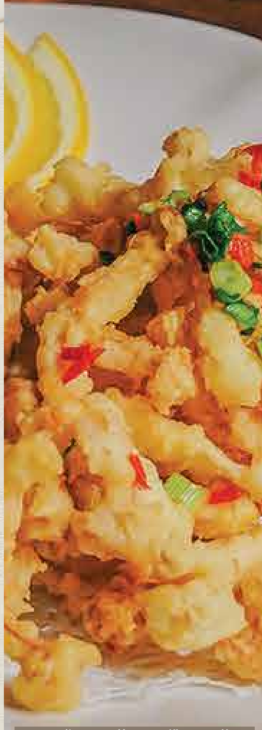
VG5 椒盐松菇 Deep Fried Shimeji Mushroom With Salt & Pepper しめじの塩胡椒炒め

VG4 亚三素鱼 RM 25 /portion Vegetarian Fish With Assam Sauce. アッサムソースのベジタリアンフィッシュ