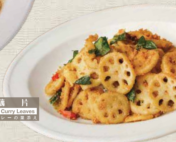
VG6 奶沙莲藕片 Deep Fried Lotus With Butter & Curry Leaves ロータスの揚げ物 バターとカレーの葉添え