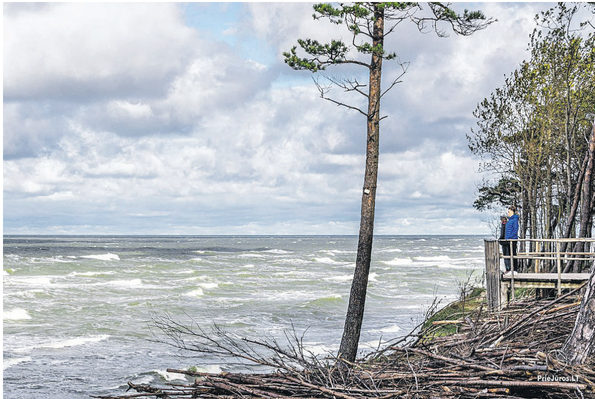
► Litorinos pažintinio tako fragmente prie gamtos paminklo „Olando kepurės“ pernai užfiksuota per 400 tūkst. lankytojų

► Valstybinė saugomų teritorijų tarnyba informavo, kad nacionalinių ir regioninių parkų pažintinius, mokomuosius takus vis gausiau lanko keliautojai. Tai fiksuoja ir takuose įrengti specialūs lankytojų srautų skaičiuotuvi. Populiariausi praėjusiais metais buvo Litorinos, Arlaviškių kadagių slėnio ir Šeirės pažintiniai takai.