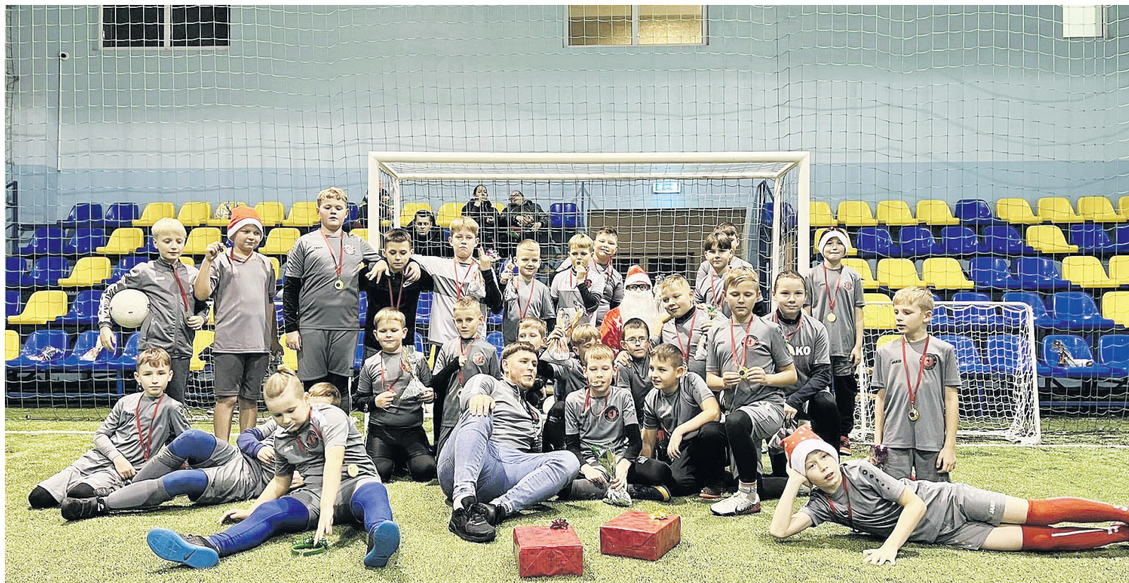
► FK „Žemaitijos lokiai“ dešimtmečiai–vienuolikmečiai futbolininkai po turnyro kovų sulaukė Kalėdų senelio su dovanomis.