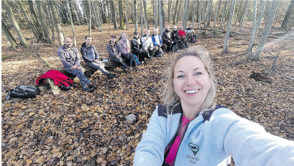
► I žīgius po gamta Lina sutrauk dēdli būri entuziastu.

► Plungės rajuonē, Purvačiu kaimē, gyvenonti Kerpauskatē Lina šešiuolika sava gražiu jaunistēs mētu praleda Londona cēntre unt pat asfalta ē baisē dēdliam triukšmē. Šindein ana miegaujēs gamtuos ramybē, niekor neskob, ved žīgius po mēškus, vo ateitie žad atidarītē mēška mokikla vakāms.