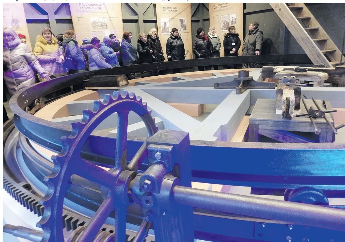
► Ekspozicija „Vėjo milžino istorija“ atskleidžia sudėtingą Klaipėdos krašto šimtmečio istoriją.

Trijuose pastatuose nuosekliai išdėstytos malūno dalys: pasukimo mechanizmai, girnos ir kita įranga, apsaugos mechanizmas. Ekspozicija pasakoja ne tik apie inžinerinį paminklą, bet ir jos savininkų šeimą, kaimą, jį puošiusius kitus malūnus.