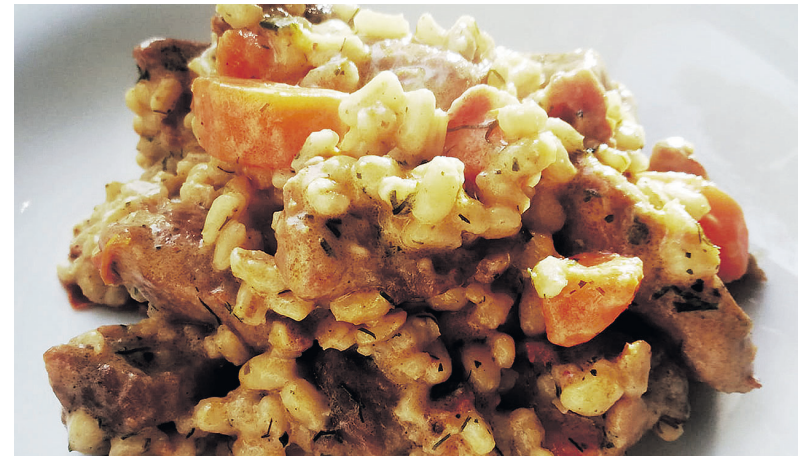
► Perlinių kruopų troškiny – puikus pasirinkimas norint šociai ir skaniai pavalgyti.