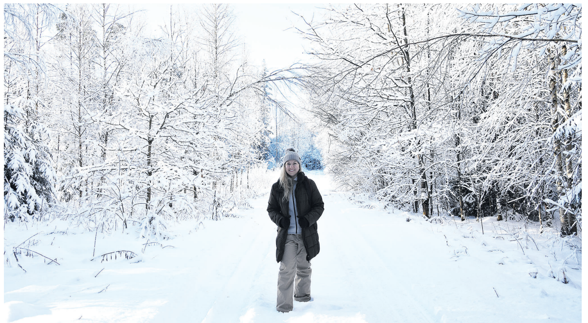
► Gamta ne tik i graži, bet ana gīda sužeistas sielas.