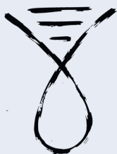
Sigilo del Caosismo

El Caosismo es una Síntesis Trascendental y Determinista que sostiene que la realidad es un Juego (Līlā) desplegado por una Conciencia Suprema: un Ser que inspira y expira, que es y deja de ser, que oscila entre lo concreto y lo abstracto.