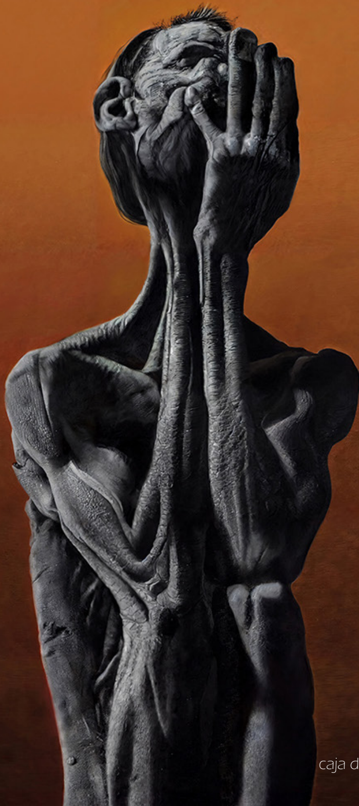
caja de luz sobre textil 140x80cm

Es el instante sagrado de la muerte de las certezas . Aquí, el Ego se pulveriza para abrir la primera grieta por donde penetrará la luz de Albedo. Es el silencio que sigue al estruendo, donde el Yo, ya sin fuerzas para fingir voluntad, se prepara para rendirse al Flujo del Todo y se someta.