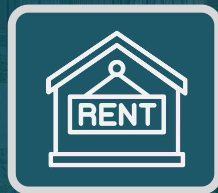
COMPRA - RENTA