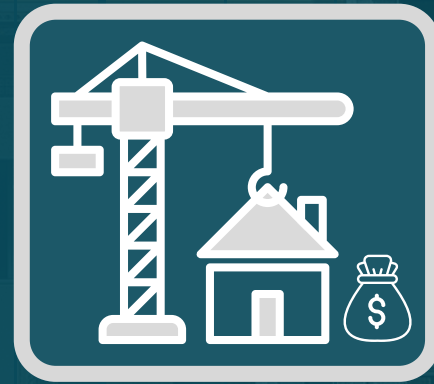
DESARROLLO - VENTA