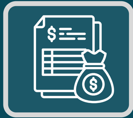
FONDOS DE INVERSIÓN