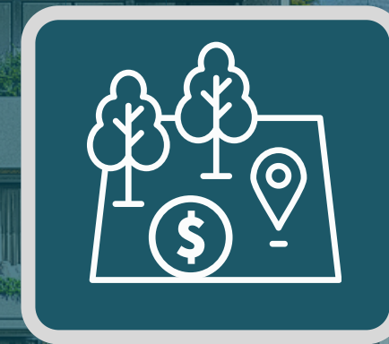
DESARROLLO DE TIERRA