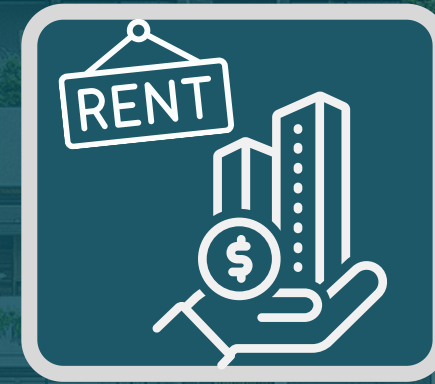
DESARROLLO - RENTA