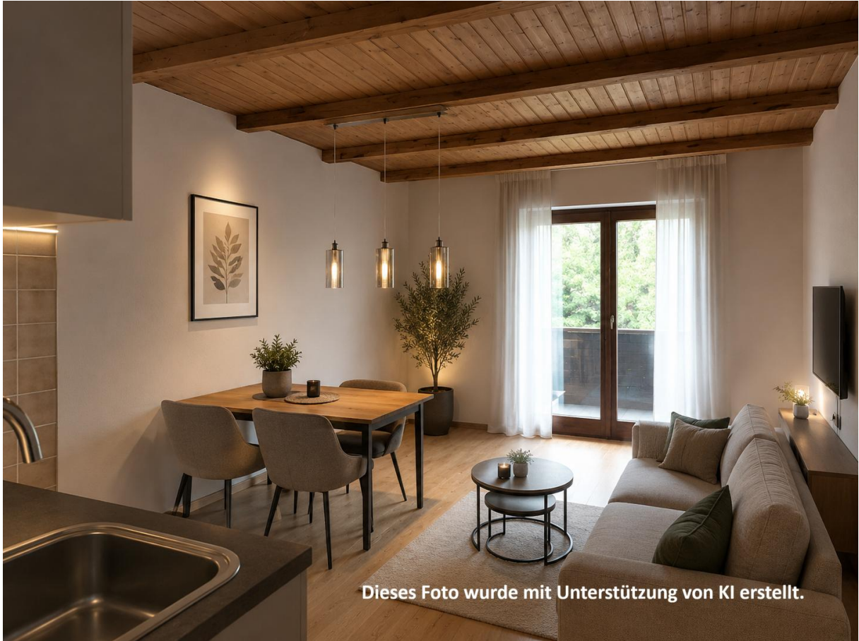
Dieses Foto wurde mit Unterstützung von KI erstellt.