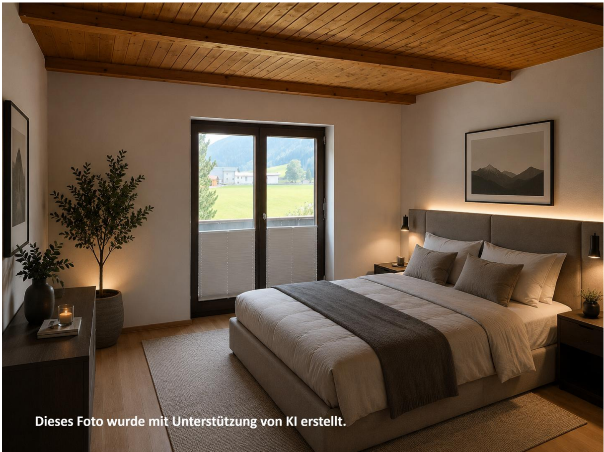
Dieses Foto wurde mit Unterstützung von KI erstellt.