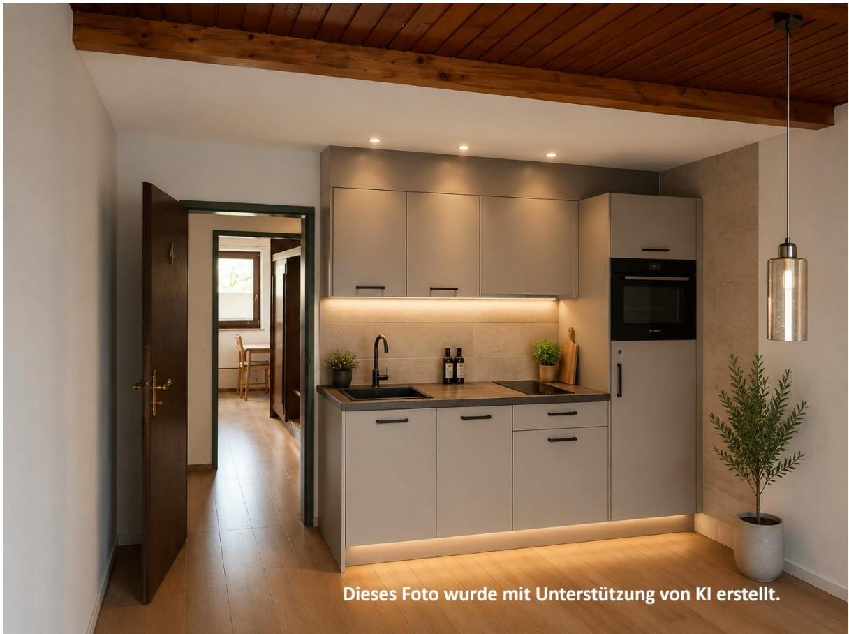
Dieses Foto wurde mit Unterstützung von KI erstellt.