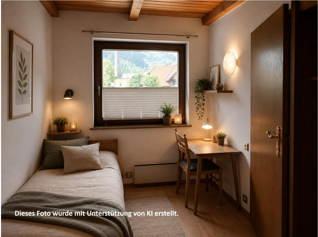
Dieses Foto wurde mit Unterstützung von KI erstellt.