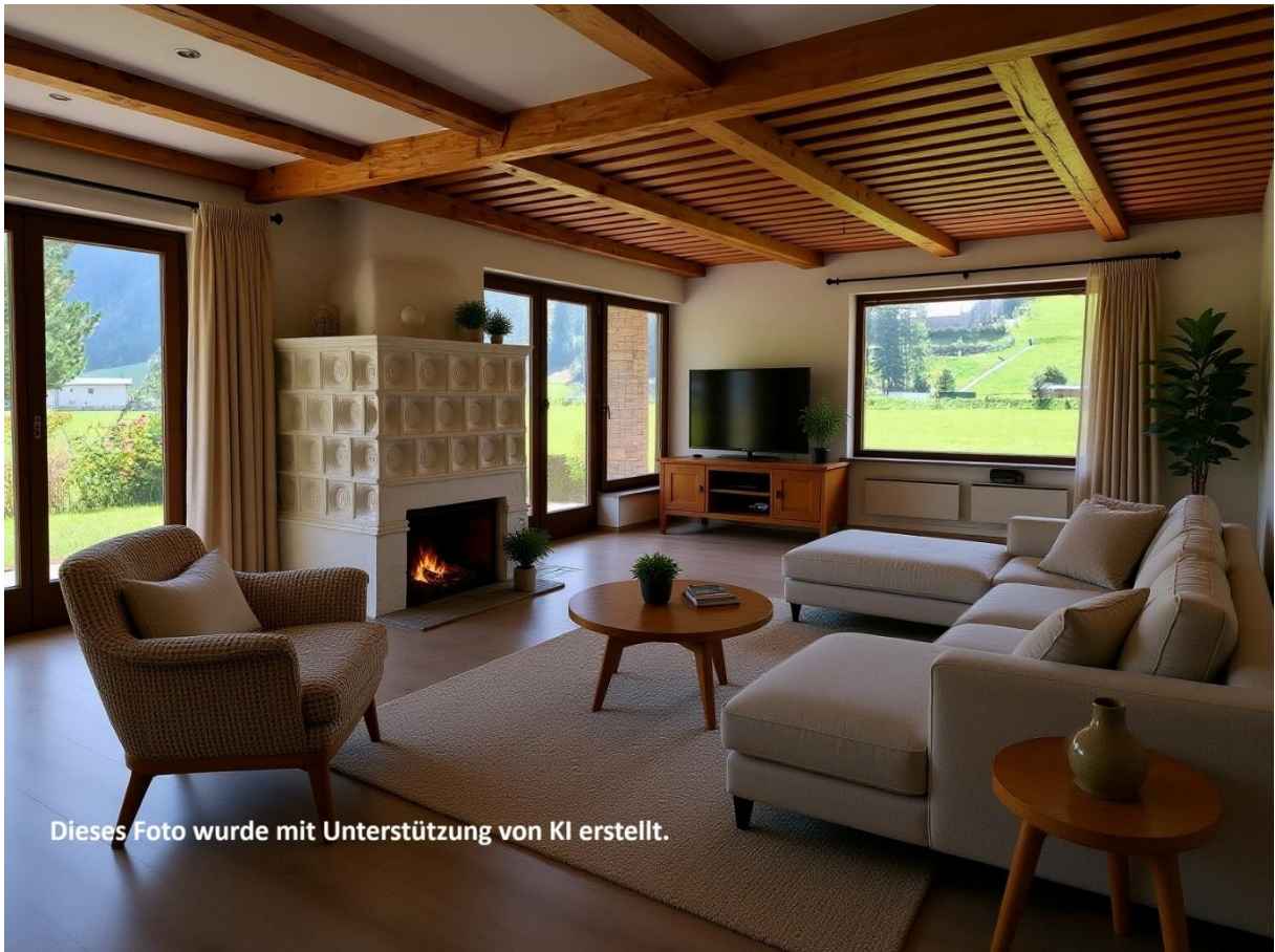
Dieses Foto wurde mit Unterstützung von KI erstellt.