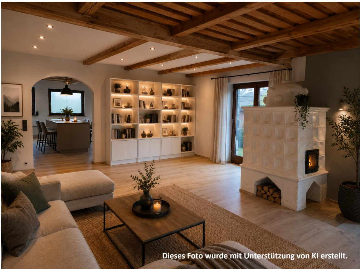
Dieses Foto wurde mit Unterstützung von KI erstellt.