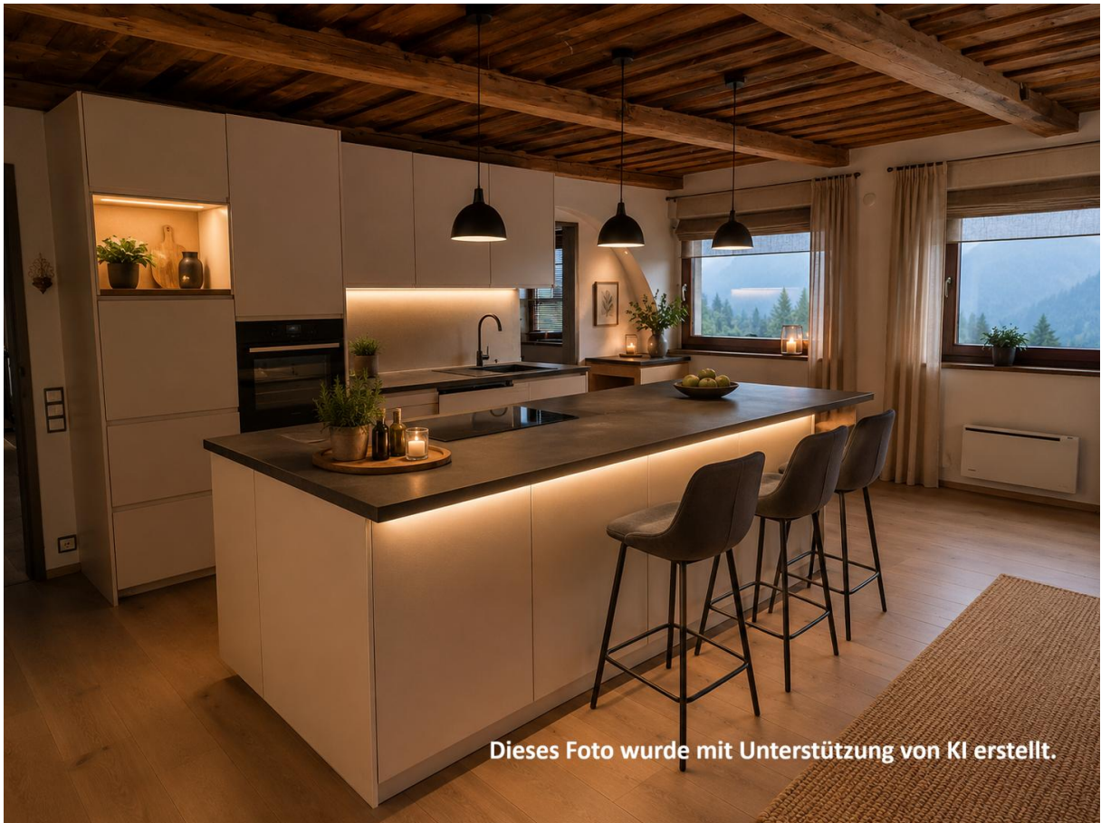
Dieses Foto wurde mit Unterstützung von KI erstellt.