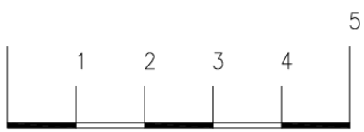
GRUNDRISS Erdgeschoß TOP 1 - 120m2