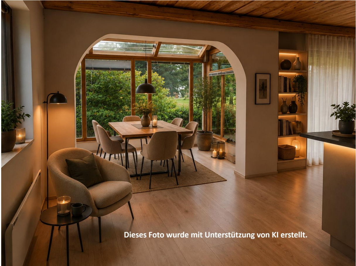
Dieses Foto wurde mit Unterstützung von KI erstellt.