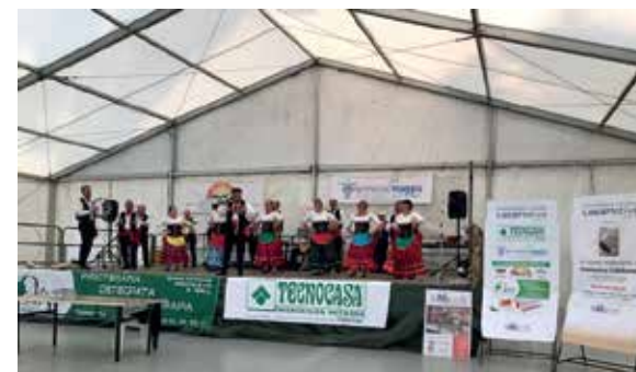
"Sicilia Nostra" gruppo Folkloristico

Sono stati sei anni intensi, con all'attivo svariati eventi al servizio dei soci e della collettività che mi hanno arricchito personalmente gratificato dell'amicizia di tante nuove conoscenze.