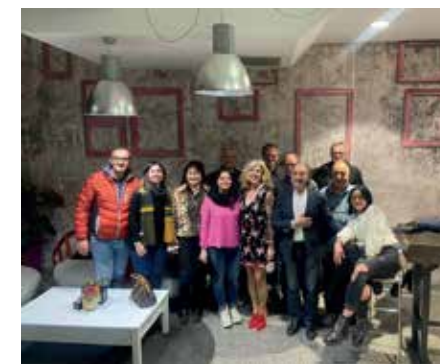
Associazione Culturale LocoMotiva