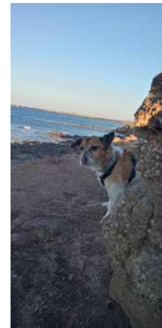
Snoopy, dalla Sicilia in Lombardia a casa nostra. Adesso è famiglia

Siamo pronti ad affrontare anche le spese necessarie per garantirgli benessere con pappe buone e cure mediche? Bisogna tenere presente che anche il cane invecchierà ed avrà sempre più bisogno di cure mediche. Valutiamo tutto quanto prima di decidere di adottare. E' meglio non adottare che farlo per poi abbandonare. Ricordiamoci che anche loro hanno sentimenti che non vanno traditi, non sono oggetti usa e getta.