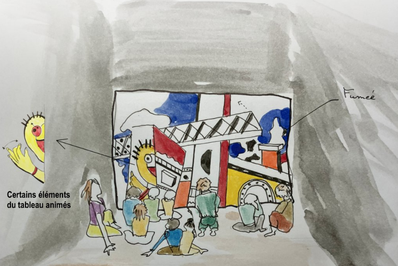
Certains éléments du tableau animés