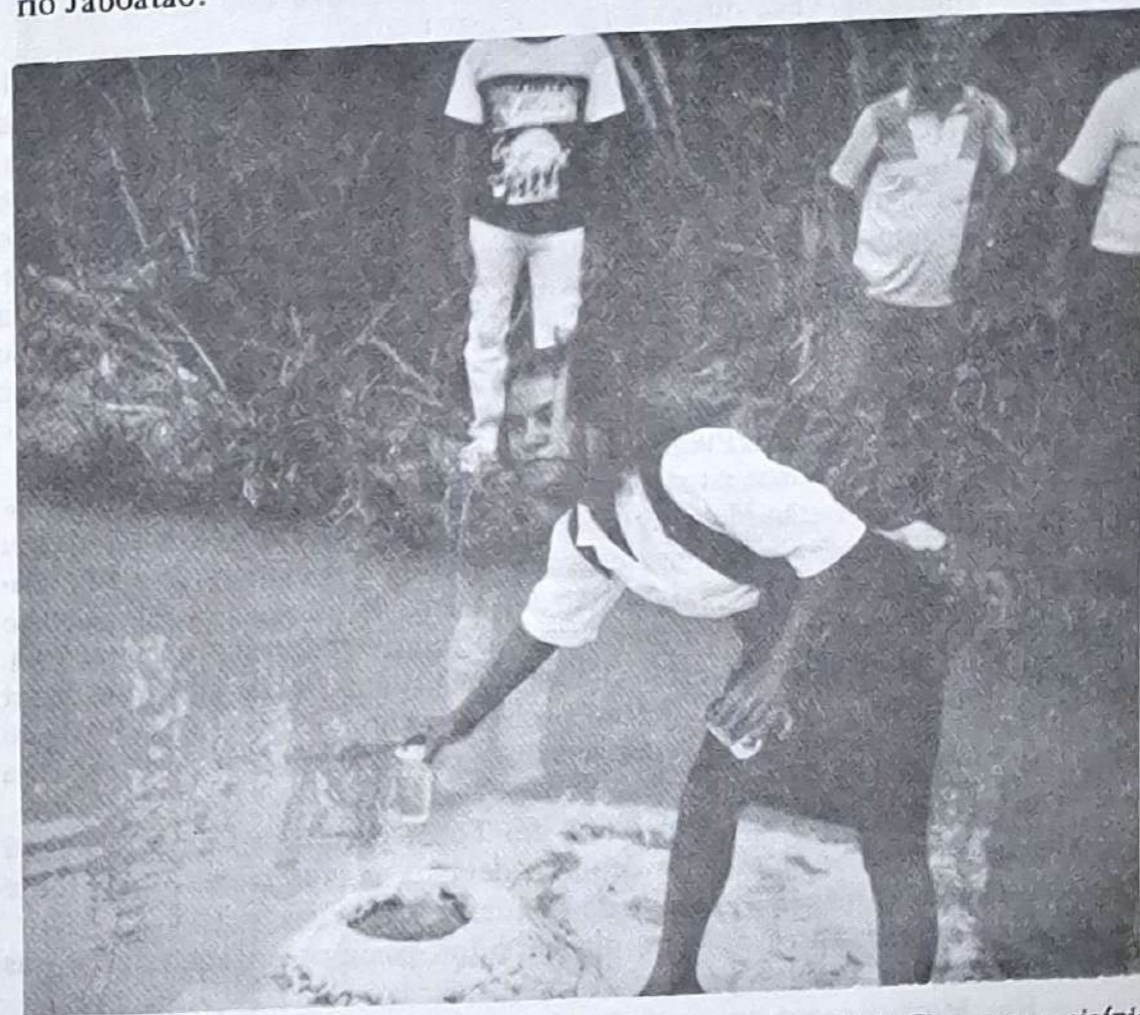
Aqui nasce o rio Jaboação, limite dos engenhos Pacas com Arandú de Cima, no município de Vitória de Santo Antão.

Vamos apontar outros equívocos lamentáveis ocorridos em nossa história. Quem escreveu sobre Jaboação, faz crer que no município só existem dois rios: o Jaboação, que nasce no engenho Pacas (sem precisar o local) em Vitória de Santo Antão e o Duas-Unas que nasce erradamente no engenho Pixaó, no município de São Lourenço quando, na realidade, o município do Jaboação possui mais sete rios e mais de vinte riachos integrando sua bacia hidrográfica! Isso eu tive de constatar, pesquisando in-loco, para saber uma verdade omitida por outras pessoas. Onde a verdadeira nascente e curso do rio Jaboação?