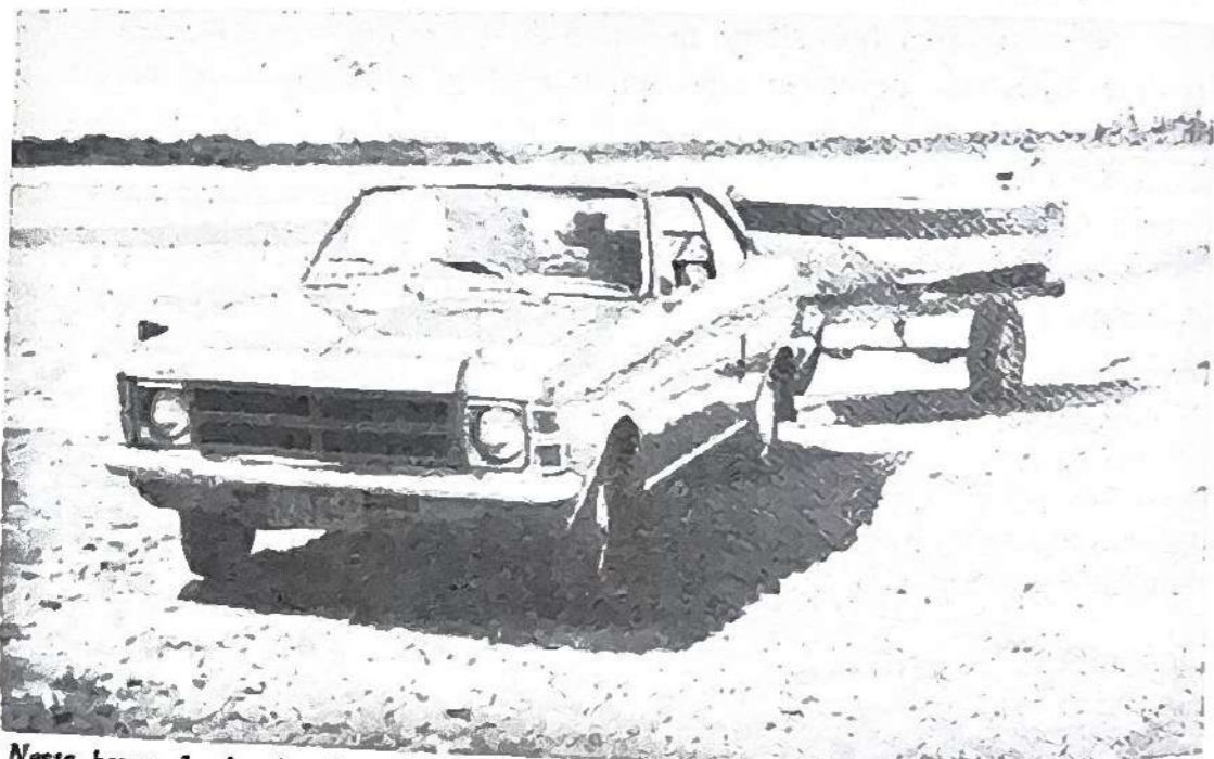
Neste barco de duralumínio, com motor Haupt de 7,5 HP, fazemos pesquisas no rio Jaboatão, assinalando suas pontes, barragens, pontos de poluição, vegetação ribeirinha, etc., inclusive as terras dos engenhos que atravessamos.

Para melhor pesquisar o rio, comprei pequeno barco com motor de popa e comecei a subir seu curso em direção ao oeste encontrando formidável tremedal coberto pelo verde vivo dos mangues que chegam a alcançar quatro metros de altura e têm suas raízes profundamente fincadas no lamaçal onde se reproduziam, aos milhares, várias espécies de saborosos crustáceos: guaiamús, caranguejos, aratús, ostras, mariscos, exterminados pelos resíduos industriais despejados nas águas do rio Jaboatão e do rio Pirapama! Algumas ilhotas desabitadas, de baixo nível de altitude, cobertas d'água nas enchentes das marés, formam canais mortos, sem correnteza, onde proliferam e se desenvolvem variadas espécies de peixes e de crustáceos, inclusive na ilha dos Amores de frente da praia do Paiva. O rio Pirapama possui água de coloração diferente da do rio Jaboatão e em muito menor escala reproduz o fenômeno do "encontro das águas" verificado em Manaus, entre os rios Negro e Solimões, ponto de atração turística do Amazonas.