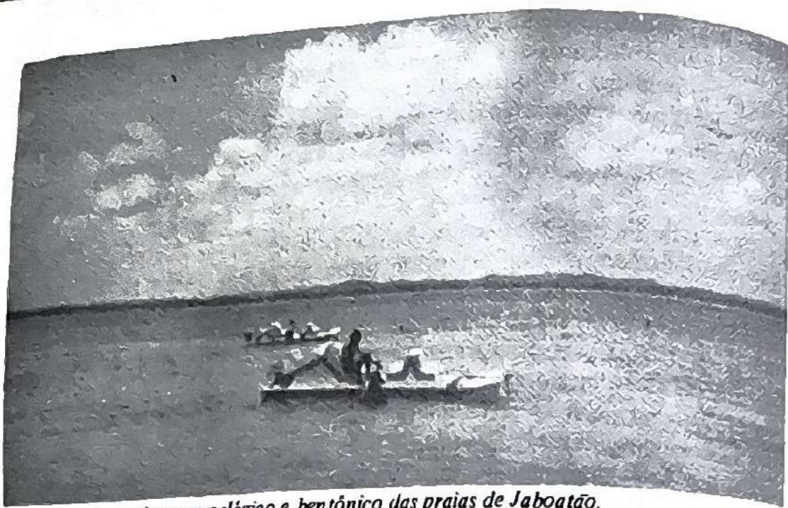
Pesquisando os sistemas pelágico e bentônico das praias de Jaboatão.

Para melhor pesquisar o rio, comprei pequeno barco com motor de popa e comecei a subir seu curso em direção ao oeste encontrando formidável tremedal coberto pelo verde vivo dos mangues que chegam a alcançar quatro metros de altura e têm suas raízes profundamente fincadas no lamaçal onde se reproduziam, aos milhares, várias espécies de saborosos crustáceos: guaiamús, caranguejos, aratús, ostras, mariscos, exterminados pelos resíduos industriais despejados nas águas do rio Jaboatão e do rio Pirapama! Algumas ilhotas desabitadas, de baixo nível de altitude, cobertas d'água nas enchentes das marés, formam canais mortos, sem correnteza, onde proliferam e se desenvolvem variadas espécies de peixes e de crustáceos, inclusive na ilha dos Amores de frente da praia do Paiva. O rio Pirapama possui água de coloração diferente da do rio Jaboatão e em muito menor escala reproduz o fenômeno do "encontro das águas" verificado em Manaus, entre os rios Negro e Solimões, ponto de atração turística do Amazonas.