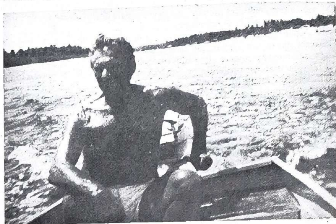
Pesquisando o rio Jaboatão.

Quem escreveu sobre Jaboatão omite a existência de mais de vinte riachos que entrecortam seu território, alguns dos quais com regular volume d'água: do Açude, Bom-Dia, Cachoeira do Pilão, Caraúna, Carnijó, Caxito, Colonia, Corisco, Cumbe, Jangadinha, Manassú, Mussaíba, Palmeiras, Pixaó, Prata, Preto, Roncador, Salgadinho, São Salvador, Tabatinga, Tejió-Mirim, Várzea dos Coelhos correndo suavemente entre doces vergeis e graciosos montes na estação de estio mas, na estação chuvosa, transbordam de seus leitos e violentos invadem as várzeas inundando planícies e baixios, ameaçando árvores e arbustos com suas águas turbulentas e amareladas.