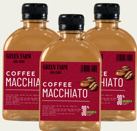
Cafe Sữa Machiato 250ml