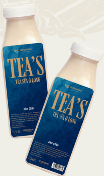
Trà Sữa Ô Long 330ml