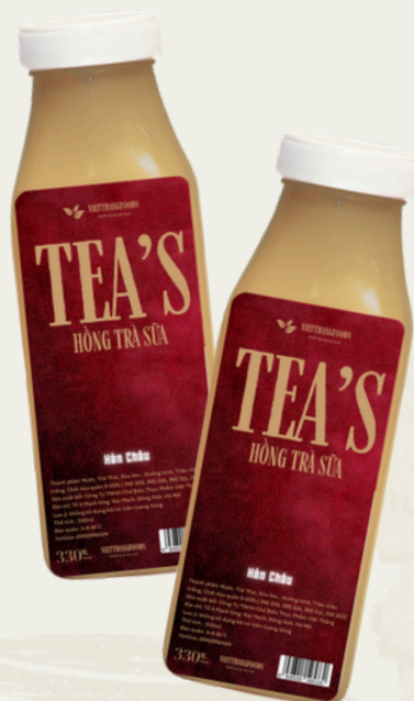
Hồng Trà Sữa 330ml