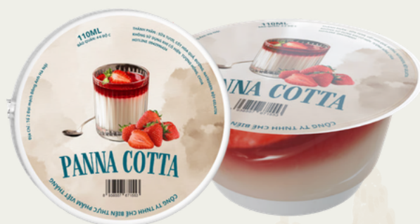
Panna Cotta 110 Gram