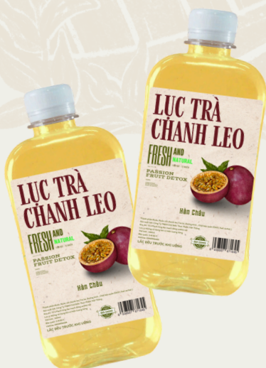
Lục Trà Chanh Leo 330ml