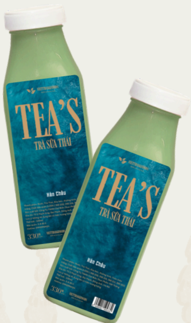
Trà Sữa Thái 330ml