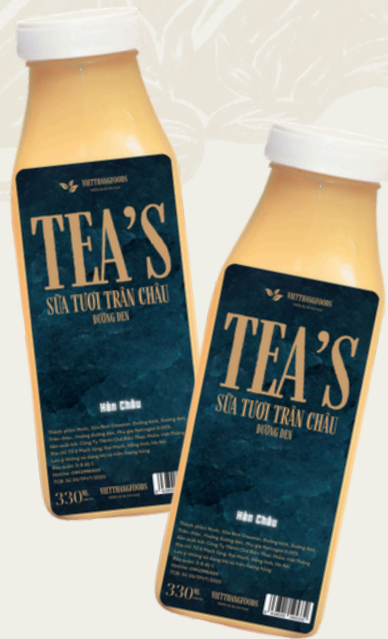
Sữa Tươi Trân Châu Đường Đen 330ml