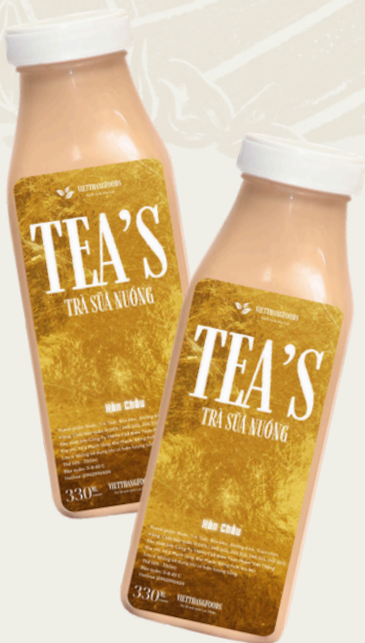
Trà Sữa Nướng 330ml