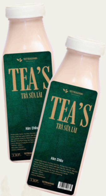
Trà Sữa Lài 330ml