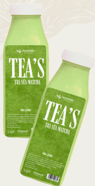
Trà Sữa Matcha 330ml