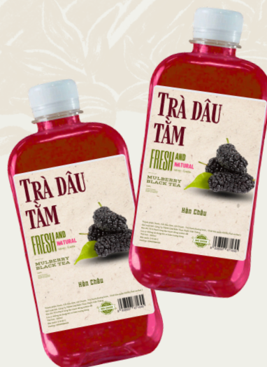
Trà Dâu Tằm 330ml