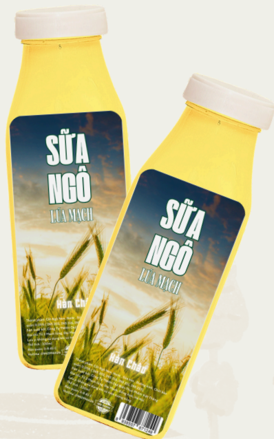
Sữa Ngô Lúa Mạch 330ml