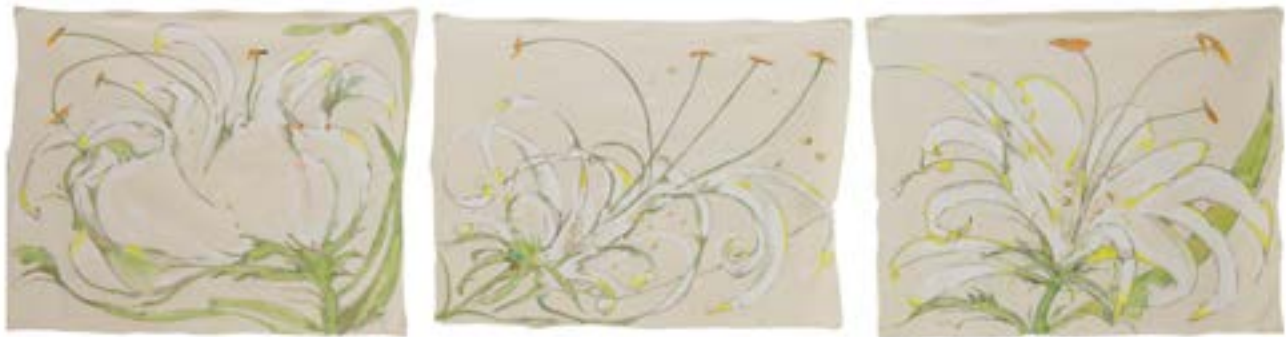
Florecer (tríptico), 2025