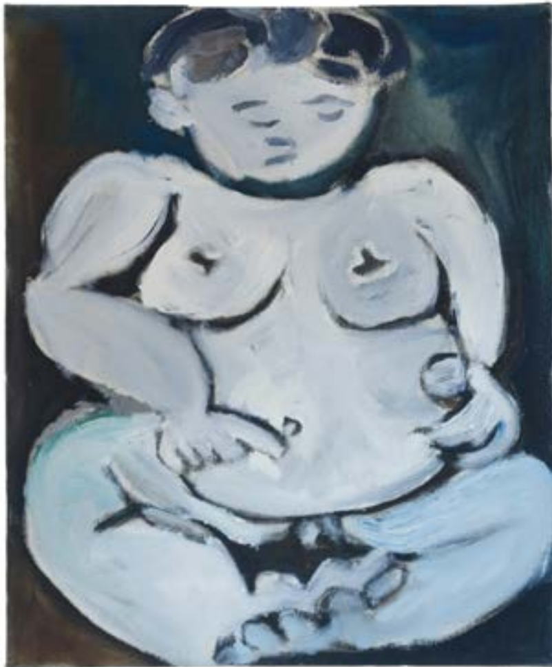
Redonda II, 2025