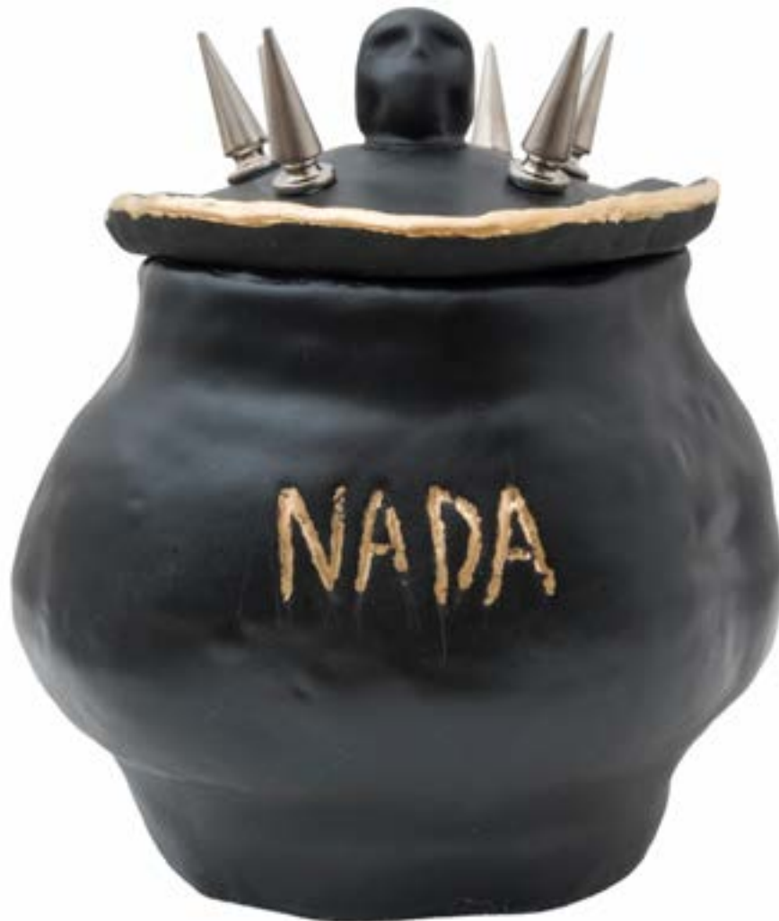
(ESP) Vasija No.1 (Nada), 2019

Barro cocido y esmaltado a alta temperatura esmaltada y spikes metálicos. 13 x 14 x 13 cm.