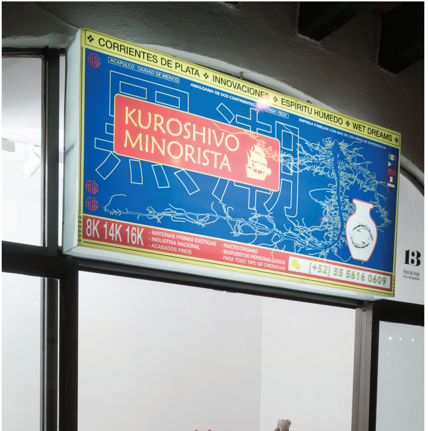
KUROSHIVO MINORISTA, 2024

Impresión sobre lamina acrilica montado sobre caja de luz 150 x 45 x 30 cm