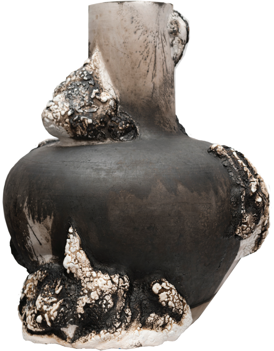
WET DREAMS V, 2024

Porcelana cono 8, raku obvara y esmelate crawl. 34 x 35 x 34 cm