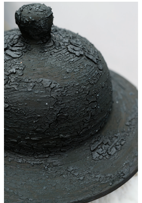
WET DREAMS II, 2024

Porcelana cono 9, vidriado transparente, esmalte texturizado y esmalte crawl. 20 x 34 x 20 cm