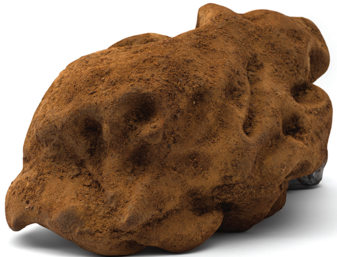
Raíz de Kuroshivo, 2024

Impresión 3D en PLA, resina epoxica con polvo tezontle y humificador con agua de coco.