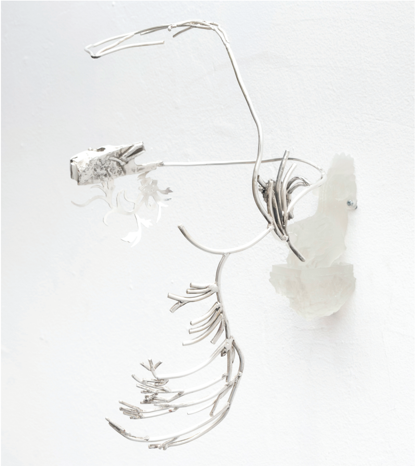
Corrientes de plata IV, 2024

Aleación de metales con baño de plata 28.7 x 32.5 x 19.5 cm