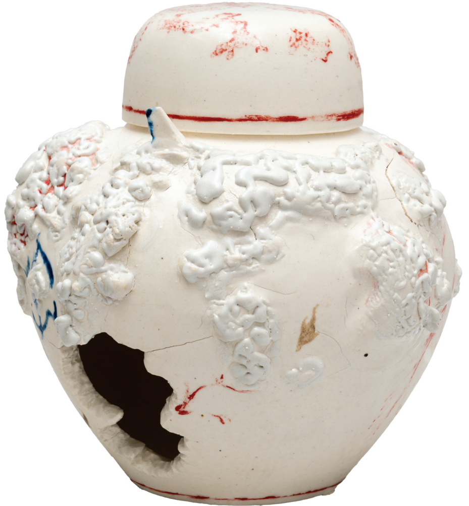
WET DREAMS I, 2024

Porcelana, cono 9, vidriado transparente y esmalte crawl 18 x 20 x 18 cm