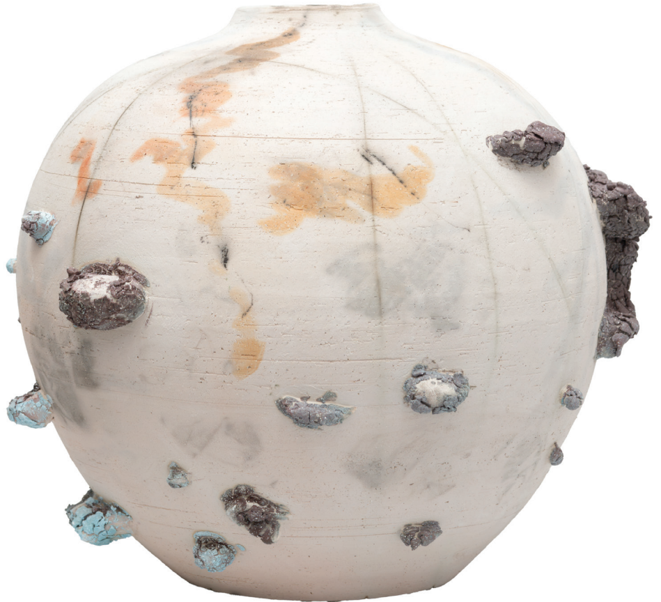
WET DREAMS III, 2024

Porcelana, cono 08, saggar y esmalte crawl 35 x 33 x 33 cm