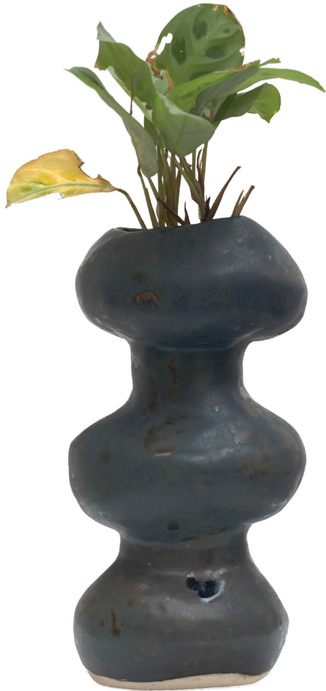
(ESP) Florero Humedo, 2024

Cerámica de alta temperatura con esmaltado original del artista 25 x 14 x 11 cm