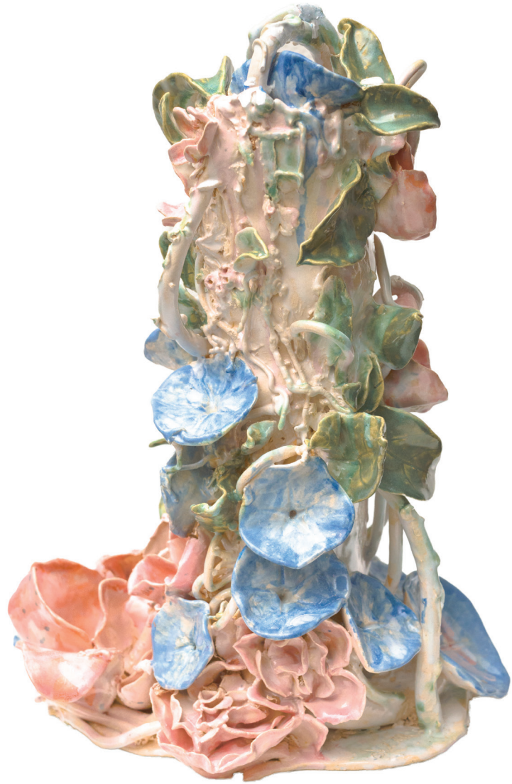
(ESP) El abandono, 2024

Cerámica de alta temperatura 23 x 23 x 17 cm